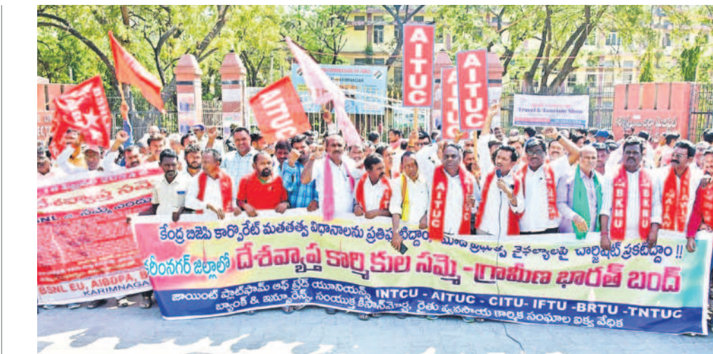
కరీంనగర్: కలెక్టర్ కు ఎదురు నిరసనలు కార్మిక సంఘాల నాయకులు