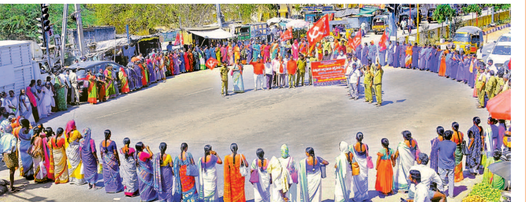
అమనగల్లులో హైదరాబాద్ - శ్రీశైలం జాతీయ రహదారిపై మానవహారాన్ని నిర్మించి నిరసన తెలుపుతున్న కార్మికులు