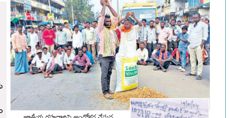
జాతీయ రహదారిపై ఆందోళన చేస్తున్న వేరుశనగ రైతులు, (ఇన్సైట్లో తెల్లకాగితంపై రాసిన తక్కువ ధర)