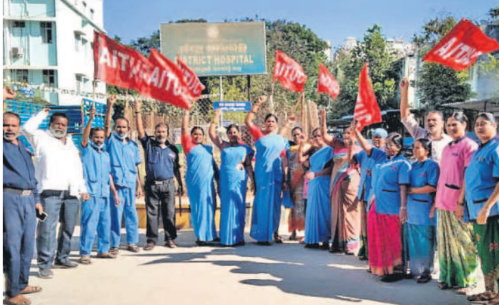
జిల్లా దవాఖానలో విధులు నిర్వహించే అందోళన చేస్తున్న కాంట్రాక్ట్, ఔట్ సోర్సింగ్ ఉద్యోగులు