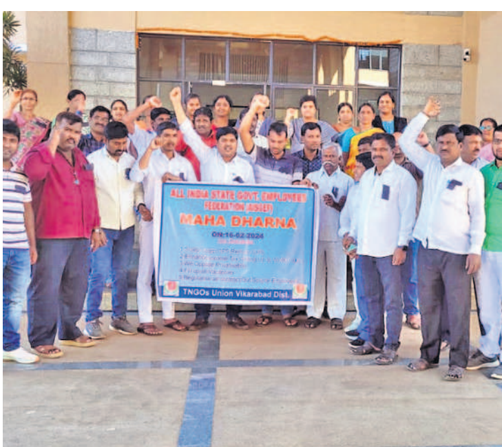
కర్ణాటకలో ధర్నా చేస్తున్న టీఎన్కేఎస్ ఉద్యోగులు