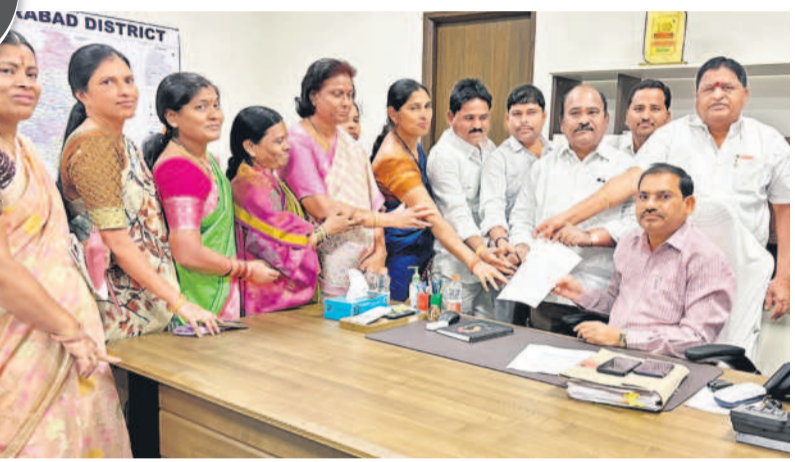
అదనపు కలెక్టర్ కు నోటీసులు అందజేస్తున్న 12 మంది జడ్పీటీసీలు