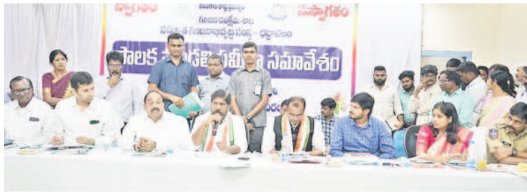
భద్రాచలం ఐటీడీఎస్ పాలక మండలి సమావేశంలో మాట్లాడుతున్న డిప్యూటీ సీఎం మల్లు భట్టి విక్రమార్క, చిత్రంలో మంత్రులు తుమ్మల నాగేశ్వరరావు, కొమటిరెడ్డి వెంకటరెడ్డి