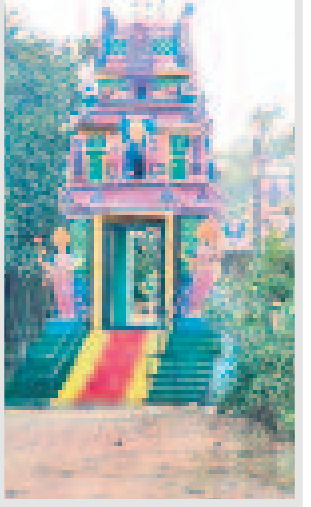
మర్రిచెట్టు వద్ద నిర్మించిన ఆలయం

మర్రిచెట్టు మధ్యలో ఆలయం నిర్మించారు. అయితే, కొన్నేండ్ల నుంచి మర్రిచెట్టు ఉసికికి ప్రమాదకరంగా మారిపోయింది. కొన్నాళ్ల క్రితం జరిగిన అగ్నిప్రమాదం వల్ల మర్రిచెట్టులో చాలా భాగం కాల్చిపోయింది. దీనికి తోడు ఇటీవల కురిసిన భారీ వర్షాల వల్ల కొంత చెట్టు ఊడలు, వేర్లు విరిగిపోయి, చెట్టు కూలిపోయింది. చాలా మర్రి ఊడలు భూమిపై ఒరిగిపోయాయి. ఐదెకరాల కొండపై నిర్మించిన మర్రిచెట్టు ప్రస్తుతం ఎకరంన్నర విస్తీర్ణానికి కుచించుకుపోయింది. ప్రస్తుత ఎమ్మెల్యే కల్వకుంట్ల కవిత నిజా మాజూరి ఎంపీగా బాధ్యతలు నిర్వహించిన సమయంలో మర్రపచ్చ చెట్టు పరిరక్షణ అలయ సుందరీకరణ కోసం ₹1.82 కోట్లను తన నిధుల నుంచి మంజూరు చేశారు.