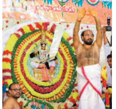
కల్యాణం నిర్వహిస్తున్న అధ్యక్షులు

కన్నుల పండుగా శ్రీ భూసమేత వేంకటేశ్వర్, లక్ష్మీనారాయణుల వివాహ వేడుక