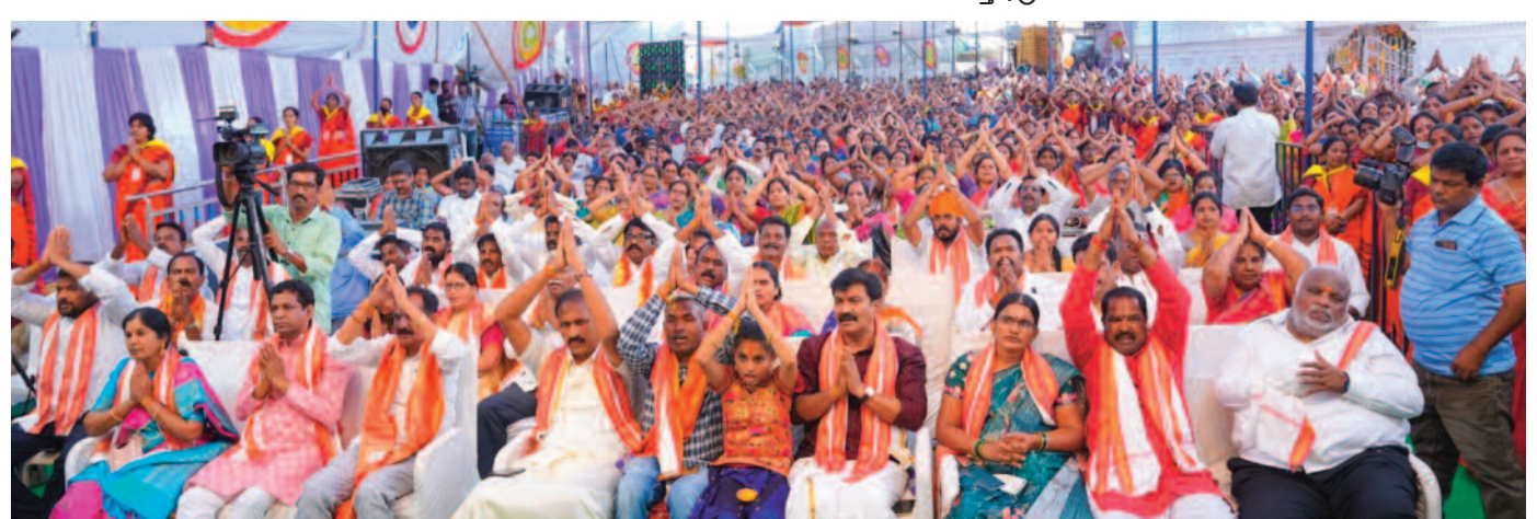
కల్యాణాన్ని తిలకిస్తున్న భక్తులు