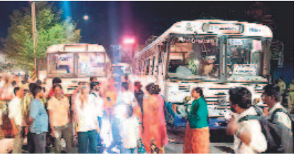
రోడ్డుపై ఆందోళన చేస్తున్న ప్రయాణికులు

సిరిసిల్లా టౌన్, ఫిబ్రవరి 18: సిరిసిల్లాలోని కొండలకల్లెట్ బాపూజీ విగ్రహం వద్ద ఆర్టీసీ బస్సు రోడ్డుపైనే మూడు గంటల పాటు నిలిచిపోయింది. దీంతో ప్రయాణికులు అవస్థలు పడ్డారు. వేములవాడ డిపోకు చెందిన బస్సు ఆదివారం వేములవాడ నుంచి హైదరాబాద్ కు బయలుదేరింది. సిరిసిల్లా మీదుగా వెళ్తున్న క్రమంలో సాయంత్రం 7.30 గంటల ప్రాంతంలో స్థానిక రేణుక ఎలక్ట్రు ఇంజనీర్ లోని కొండల కల్లెట్ బాపూజీ విగ్రహం వద్ద సడెన్గా నిలిచిపోయింది. దీంతో డ్రైవర్ అధికారులకు సమాచారం అందించగా, దాదాపు మూడు గంటలు గడిచినా ఎలాంటి ప్రత్యామ్నాయ చర్యలు చేపట్టకపోవడంతో ప్రయాణికులు అసహనం వ్యక్తం చేశారు. రోడ్డుపై ఖైదయించి ఆందోళనకు దిగుతున్న క్రమంలో మరో బస్సును ఏర్పాటుచేసి ప్రయాణికులను పంపించారు.