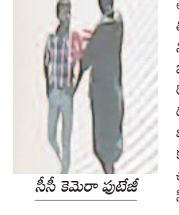
సీసీ కెమెరా ఫుటేజీ