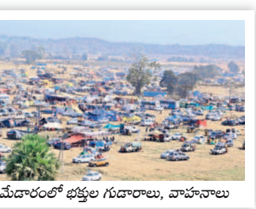
మేడారంలో భక్తుల గుడారాలు, వాహనాలు