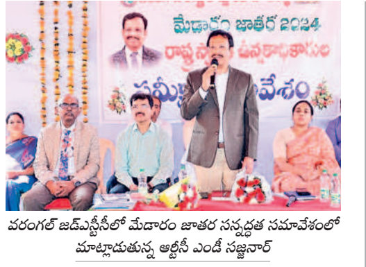
వరంగల్ జిల్లాలో మేడారం జాతర సన్నద్ధత సమావేశంలో మాట్లాడుతున్న ఆర్టీసీ ఎంపీ సజ్జనార్