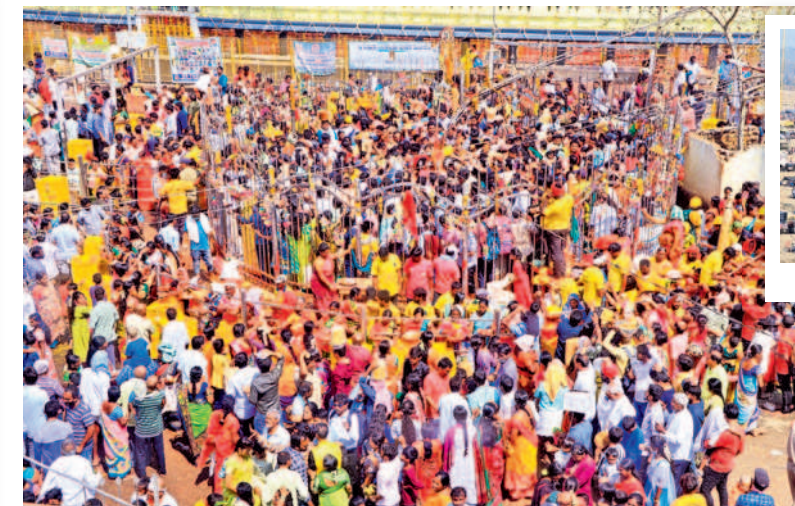
అమ్మవార్ల గడ్డల వద్ద మొక్కులు చెల్లించుకుంటున్న భక్తులు