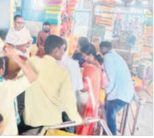
స్వామివారి దర్శనం కోసం క్యూలో ఉన్న భక్తులు

మాచారెడ్డి, ఫిబ్రవరి 18: జిల్లాలోని ప్రముఖ ఆలయాల్లో ఆదివారం భక్తుల సందడి నెలకొన్నది. మాచారెడ్డి మండలం సంగ్లూపూర్ లక్ష్మీస్వామి సామస్వామి భక్తులు పెద్ద సంఖ్యలో దర్శించుకున్నారు. ఒడిషీయ్యం, పట్టణామాలు, కోరమినాలు, కండ్ల సమర్పించి మొక్కులు చెల్లించుకున్నారు. భక్తులకు ఇబ్బందులు కల్గకుండా ఆలయ కమిటీ ఆధ్వర్యంలో ఏర్పాటు చేశారు.