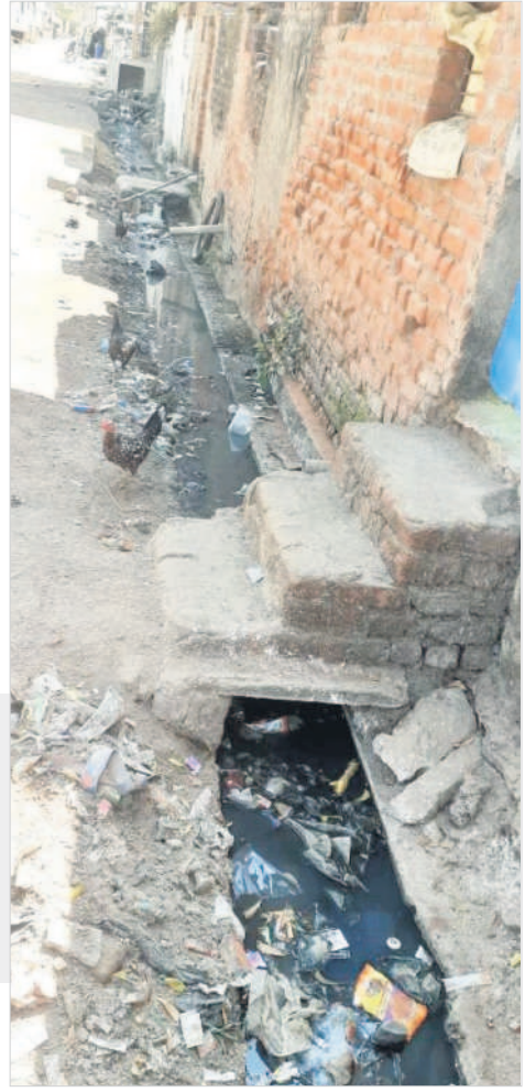
మురికి కాలువలో పేరుకుపోయిన చెత్త

బిమ్మండల, ఫిబ్రవరి 18: గ్రామాలను పరిశుభ్రంగా మార్చేందుకు ప్రభుత్వం ప్రత్యేక పారిశుధ్య వారోత్సవాలను నిర్వహించింది. పట్టణ, పట్టణాల్లో ఎక్కడ కూడా చెత్తాచెదారం లేకుండా, మురికి కాలువలు శుభ్రంగా ఉండేలా తీర్చిదిద్దడం వారోత్సవాల లక్ష్యం. కానీ అధికారుల పర్యవేక్షణ లోపం, గ్రామ స్థాయిలో సిబ్బంది నిర్లక్ష్యం కారణంగా ప్రభుత్వ లక్ష్యం నెరవేరలేదు. పారిశుధ్య వారోత్సవాల ముగిసినా పట్టణ ఇంకా చెత్తాచెదారం దర్శనమిస్తున్నది. మురికి కాలువలు కంపు కొడుతున్నాయి. మండలంలోని మండల కేంద్రమైన బిమ్మండలలో పారిశుధ్య వారోత్సవాలను నామమాత్రంగా నిర్వహించారు. 13, 14వ వార్డుల్లో మురికి కాలువల పరిస్థితి అధ్వాన్నంగా మారినా, పైపైస మురికిని తొలగించడంతో ప్రస్తుతం కాలువల్లో నీరు సరిగా పారడం లేదు. మురికి నీరంతా ఒకేచోట ఆగడంతో దోమల బెడక ఎక్కువై రోగాల బారిన పడుతున్నామని ప్రజలు వాపోతున్నారు. బిమ్మండల ఆవరణలోని దుకాణాదారులు, హోటళ్ల సముదాయాల వారు చెత్తను పారేయడంతో దుర్గంధం వెదజల్లుతున్నది. దీంతో ప్రయాణికులు తీవ్ర ఇబ్బందులను ఎదుర్కొంటున్నారు. మండలంలోని అన్ని గ్రామ పంచాయతీల్లో పరిస్థితి ఇలాగే ఉన్నదని మండలపాలకులు వాపోతున్నారు. ప్రస్తుతం పట్టణ ప్రత్యేక అధికారుల పాలన కొనసాగుతుండడంతో పరిస్థితి మరి దారుణంగా మారిందని అంటున్నారు. ఒక్కో అధికారికి రెండు, మూడు గ్రామాలను అప్పగించడంతో వారు శాఖా పరమైన పనులను చూస్తూ..