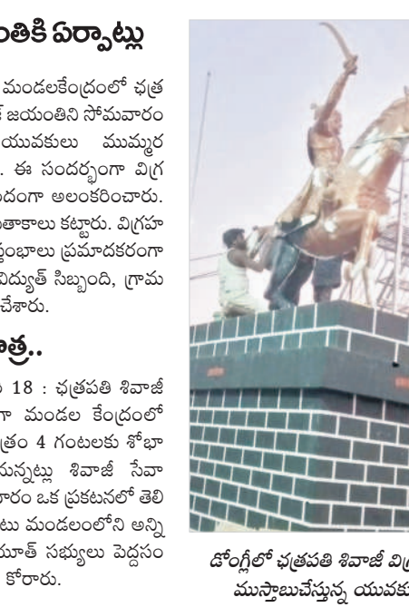
దోంగ్లో ఫత్రపతి శివాజీ విగ్రహాన్ని ముస్తాబుచేస్తున్న యువకుడు

దోంగ్, ఫిబ్రవరి 18: మండలకేంద్రంలో ఫత్ర పతి శివాజీ మహారాజ్ జయంతిని సోమవారం నిర్వహించేందుకు యువకులు ముమ్మరం ఏర్పాట్లు చేస్తున్నారు. ఈ సందర్భంగా విగ్రహ హోమ్ ఆదివారం అందంగా అలంకరించారు. వీధుల్లో కాషాయపు పతాకాలు కట్టారు. విగ్రహ స్థానికులు తమకు సమర్పించిన విద్యుత్ స్తంభాలు ప్రమాదకరంగా ఉండడంతో వాటిని విద్యుత్ సిబ్బంది, గ్రామ యువకులు కలిసి సరిచేశారు.