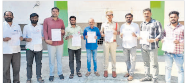
వరకా పత్రాలను అవిష్కరిస్తున్న అధికారులు, ఎన్ఎస్ఐ బాధ్యులు