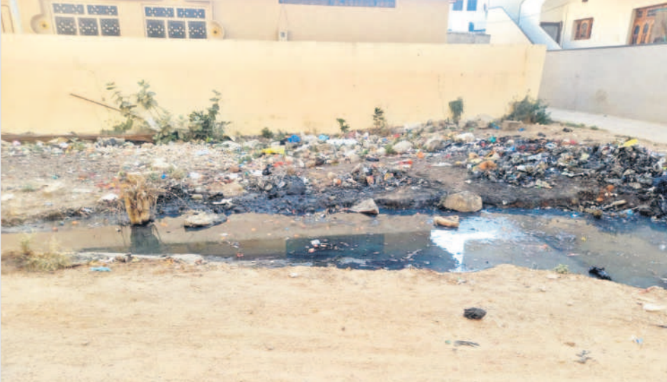
బిమ్మండలలోని 14వ వార్డులో ఇండ్ల మధ్య రోడ్డుపై నిలిచిన మురుగునీరు