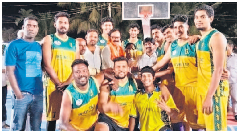
విజేతలకు బహుమతులను అందజేస్తున్న ఎమ్మెల్యే విజయకు