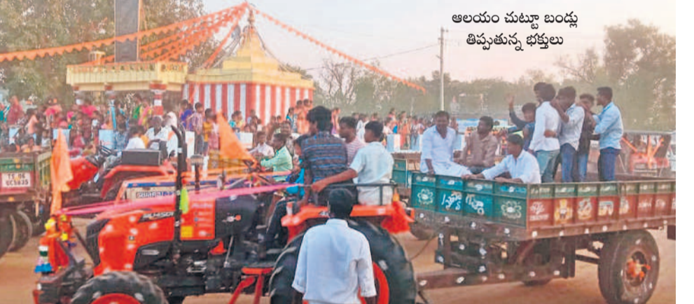
ఆలయం చుట్టూ బండ్లు తిప్పుతున్న భక్తులు

ముసాబేట (అడ్డాకుల), ఫిబ్రవరి 18 : మం డలంలోని రావాలలో చేసిన కేవలం బ్రహ్మాత్మ వారో భాగంగా ఆదివారం బండ్ల ఊరేగింపు నిర్వహించారు. బండ్లబండ్లు, కార్లు, ట్రాక్టర్లు, ఆ టోలు, బైకేట్లతోపాటు ఇతర వాహనాలను రం గులతో ముస్తాబు చేసి గ్రామంలో ఊరేగించారు. అనంతరం స్వామివారి ఆలయం చుట్టూ ప్రదక్షి ణలు చేశారు. ఆదివారం ఉమ్మడి జిల్లాస్థాయి కబడ్డీ పోటీలు కొనసాగుతున్నాయి. ఉత్సవాలలో ప్రధానపాత్ర వహించిన బండ్లబండ్లు పోటీలను సో మవారం సాయంత్రం నిర్వహించనుండగా, భ క్తులు అధికసంఖ్యలో తరలిరానున్నారు.