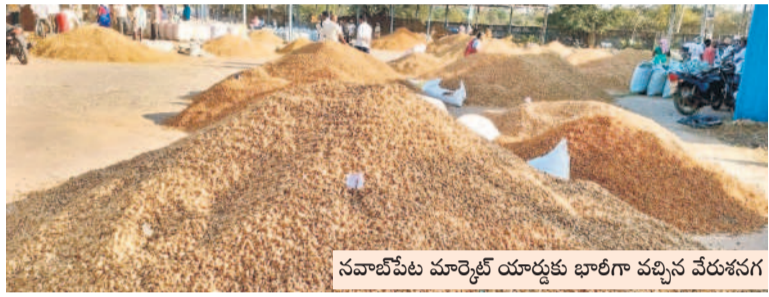
నవాబేపేట మార్కెట్ యార్డుకు భారీగా వచ్చిన వేరుశనగ