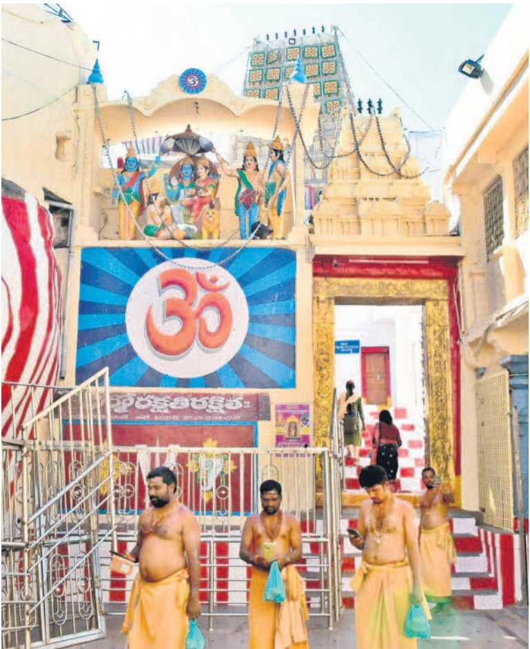
బ్రహ్మాత్మవారి ముస్తాబైన ప్రధాన ఆలయ ముఖద్వారం