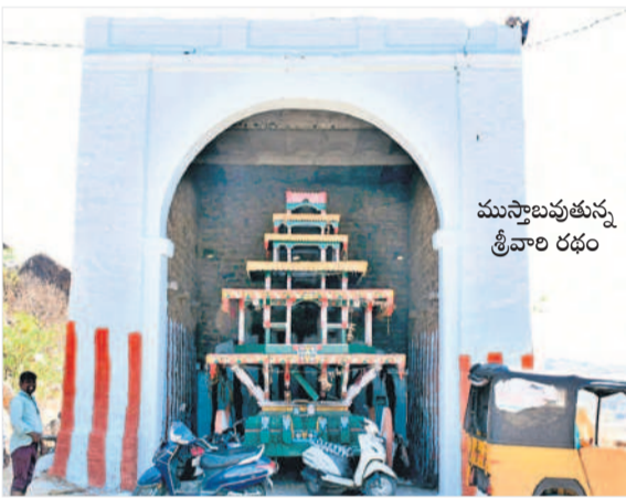
ముసాబుత్తున్న శ్రీవారి రథం