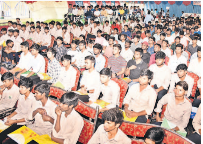
అవగాహన సదస్సుకు హాజరైన విద్యార్థులు