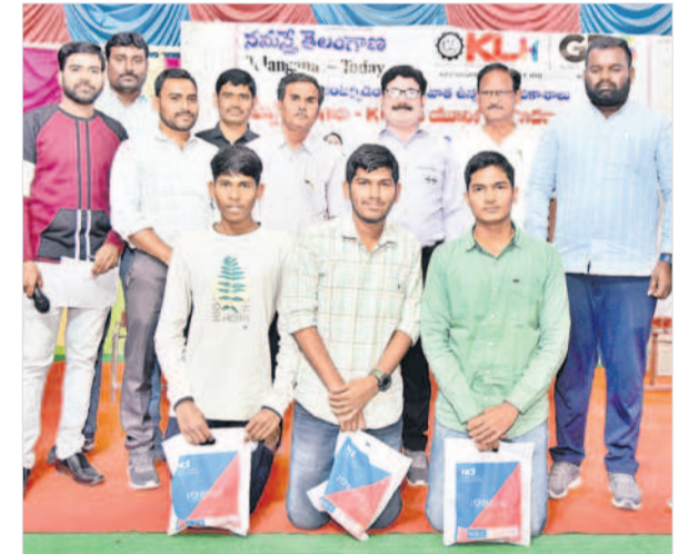
విద్యార్థులకు బహుమతులు అందజేస్తున్న ప్రాఫెసర్లు, సమస్తి తెలంగాణ సీబియం