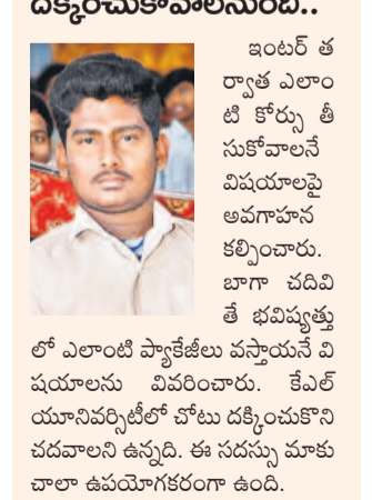
ఇంటర్ త ర్వాత ఎలాంటి కోర్సు తీసుకోవానే విషయాలుపై అవగాహన కల్పించారు. బాగా చదివితే భవిష్యత్తులో ఎలాంటి ప్యాకేజీలు వస్తాయనే విషయాలు వివరించారు. కేవల యూనివర్సిటీలో చోటు దక్కించుకోని చదవాలని ఉన్నది. ఈ సదస్సు మాకు చాలా ఉపయోగకరంగా ఉంది.