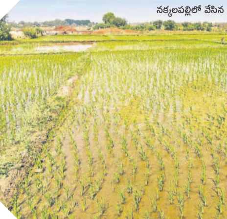
నక్కలపల్లిలో వేసిన వరి నాట్లు

కంగా మంచు కరువువడంతో పరి నారు పూర్తిగా దెబ్బ తిన్నది. మళ్ళీ పరి సాగు పోసి నాట్లు వేసే సరికి ఆలస్యం అవుతుందని పంట చేతికి వచ్చే సమయంలో ఆకాల వర్షాలు దెబ్బతినాయని భావన కూడా కొంత మంది రైతుల్లో ఉంది. వర్షాలంలో కూడా తక్కువ వర్షాలు కురువడంతో భూగర్భ జలాలు కూడా అంత తక్కువ మాత్రంగానే ఉన్నాయి. ప్రభుత్వం మారడంతో కరెంట్ పాలిసీలు ఏ విధంగా ఉంటాయోనన్న ఆందోళన కూడా రైతుల్లో ఉన్నది. ఈ నేపథ్యంలో ఈసారి