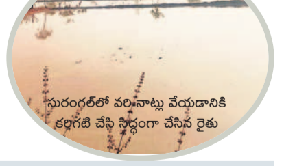
గురంగల్లో వరినాట్లు వేయడానికి కలిగి వేసి సాగు చేసిన రైతు