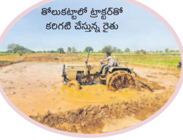
ఈ ఏడాది సన్నరకం 80 శాతం సాగు

పరి సాగు కంటే స్వల్పకాలిక పంటలు సాగు చేసుకుంటున్నారని కొంత మంది రైతులు వరి నాట్లు వేయడానికి ఆసక్తి చూపడంలేదు. బియ్యం రేటులు విపరీతంగా మార్కెట్లో పెరగడంతో పరి సాగు చేసుకుంటేనే అధిక ఆదాయం పొందవచ్చని కొంత మంది రైతులు ధైర్యం వేసి పరి నాట్లు ఇప్పటికీ వేస్తున్నారు. ముందు కారణంగా నారు మడలో నారు దెబ్బతిందంతో మళ్ళీ నారు పోసి పరి నారు చేతికి రావడం ఆలస్యం కావడంతో పరి నాట్లు వేయడానికి అదనపు సమయం కేటాయింపడం జరిగింది. ఆలస్యమైనా దేవుడిపై భారం వేసి పరినాట్లు వేస్తున్నారని కొంత మంది రైతులు చెబుతున్నారు. యూసీలో ప్రధాన పంటగా పరి సాగు మాత్రమే ఉంటుంది. వాసకాలంలో సన్నరకం పరి సాగు వేసే రైతులు యూసీలో దొడ్డు రకం పరి సాగు చేస్తున్నారు. ఈ ఏడాది సన్నరకం బియ్యం నికీ మార్కెట్లో మంచి డిమాండ్ ఉండడంతో రైతులు సన్నరకం వేయడానికి ఆసక్తి చూపుతున్నారు. గత