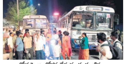
రోడ్డుపై అందోళన చేస్తున్న ప్రయాణికులు

సిరిసిల్లా టౌన్, ఫిబ్రవరి 18: సిరిసిల్లాలోని కొండలకల్లె బాపూజీ విగ్రహం వద్ద ఆర్టీసీ బస్సు రోడ్డుపైనే మూడు గంటల పాటు నిలిచిపోయింది. దీంతో ప్రయాణికులు అవస్థలు పడ్డారు. వేములవాడ డిపోకు చెందిన బస్సు ఆదివారం వేములవాడ నుంచి హైదరాబాద్ కు బయలుదేరింది. సిరిసిల్లా మీదుగా వెళ్తున్న క్రమంలో సాయంత్రం 7.30 గంటల ప్రాంతంలో స్థానిక రేజులకు ఎల్లప్పుడూ ఇంకనీ లోని కొండా లక్ష్మణ్ బాపూజీ విగ్రహం వద్ద సడెన్గా నిలిచిపోయింది. దీంతో డ్రైవర్ అధికారులకు సమాచారం అందించగా, దాదాపు మూడు గంటలు గడిచినా ఎలాంటి ప్రత్యామ్నాయ చర్యలు చేపట్టకపోవడంతో ప్రయాణికులు అసహనం వ్యక్తం చేశారు. రోడ్డుపై ఖైదయింది అంటేనే చూసి దిగుతున్న క్రమంలో మరో బస్సును ఏర్పాటుచేసి ప్రయాణికులను పంపించారు.