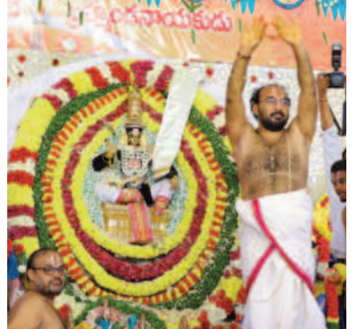
కల్యాణం నిర్వహిస్తున్న అధ్యక్షులు

కన్నుల పండుగా శ్రీ భూసమేత వేంకటేశ్వర్ల, లక్ష్మీనారాయణుల వివాహ వేడుక