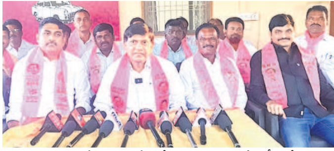
మానకొండూర్: విలేజరుల సమావేశంలో మాట్లాడుతున్న మాజీ ఎంపీ వినోద్ కుమార్

మానకొండూర్, ఫిబ్రవరి 18: వచ్చే పార్లమెంట్ ఎన్నికల్లో కరీంనగర్ గడ్డపల్లి గులాబీ జెండా ఎగరాలని మాజీ ఎంపీ బీ వినోద్ కుమార్ పిలుపునిచ్చారు. కరీంనగర్ పార్లమెంట్ నియోజకవర్గాల జీఆర్ఎస్ మండలాధ్యక్షులతో ఆదివారం మానకొండూర్ మండల కేంద్రంలోని మీనాక్షి కన్వెన్షన్ హాల్లో నిర్వహించిన సమావేశానికి ముఖ్యఅతిథిగా హాజరయ్యారు. పార్లమెంట్ ఎన్నికలపై నాయకులు దిశానిర్దేశం చేశారు. బీఆర్ఎస్ శ్రేణులు ఎవరూ అధిర్యవదొడ్డు, కార్యదేవులు కడుపులో పెట్టుకుని చూసుకుంటామని హామీ ఇచ్చారు. కాంగ్రెస్ ప్రభుత్వం ఆచరణకు సాధ్యంకాని హామీలు ఇచ్చి అబద్ధాల పునాదులపై అధికారంలోకి వచ్చిందని మండిపడ్డారు. వంద రోజుల్లో ఆరు గ్యారంటీలు అమలు చేస్తామని హామీ ఇచ్చిందని, గడువు దగ్గర పడుతున్నా ఇప్పటి వరకు ఎందుకూ అమలు చేయడంలేదో చెప్పాలని ప్రశ్నించారు. ఆరు గ్యారంటీలు అమలు చేసే దాకా ప్రజల పక్షాన బీఆర్ఎస్ పోరాడుతుందని విలేజరులతో ఆయన మాట్లాడారు. వేసవికి పేర్కొన్నారు. యాసంగిలో క్వింటాలుకు రూ.500 బోనస్ ఇస్తామని కాంగ్రెస్ ప్రభుత్వం హామీ ఇచ్చిందని ఏప్రిల్, మే మాసాల్లో ఇచ్చిన హామీని ప్రభుత్వం అమలు చేసే రైతాకాన్ని ఆదుకోవాలని డిమాండ్ చేశారు.