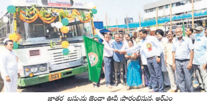
జాతర బస్సును జెండా ఊపి ప్రారంభిస్తున్న ఆర్ఎం

రూ.280, పిల్లలకు రూ.210 టికెట్ నిర్ణయం చూపి, ప్రతి 10 నిమిషాలకు ఒక బస్సు బయలుదేరుతున్నది. పెద్దపల్లి జిల్లా పరిధిలోని పెద్దపల్లి, గోదావరిఖని, మంథని, ధైటింకెనేకాలి, నంది, నంది జాతర బస్సులు మేడారానికి తిప్పారు. ఈ నాలుగు పాఠశాలల్లో ఉండాలి. ఆయా పాఠశాలల నుంచి బస్ చార్జీ అమలు అధికారులు వెల్లడించారు. పెద్దపల్లి నుంచి పెద్దలకు రూ. 880, పిల్లలకు రూ. 210, గోదావరిఖని, ధైటింకెనేకాలి నుంచి పెద్దలకు రూ. 870, పిల్లలకు రూ. 200, మంథని నుంచి పెద్దలకు రూ. 820, పిల్లలకు రూ. 180గా ప్రకటించారు.