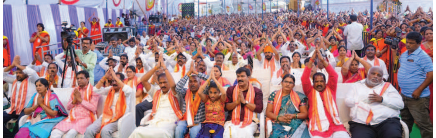
కల్యాణాన్ని తిలకిస్తున్న భక్తులు