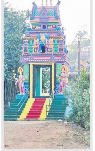
మర్రిచెట్టు వద్ద నిర్మించిన ఆలయం

మర్రిచెట్టు మధ్యలో ఆలయం నిర్మించారు. అయితే, కొన్నేండ్ల నుంచి మర్రిచెట్టు ఉనికికి ప్రమాదకరంగా మారిపోయింది. కొన్నాళ్ల క్రితం జరిగిన అగ్నిప్రమాదం వల్ల మర్రిచెట్టులో చాలా భాగం కాల్చిపోయింది. దీనికి తోడు ఇటీవల కురిసిన భారీ వర్షాల వల్ల కొంత చెట్టు ఊడలు, వేర్లు విరిగిపోయి, చెట్టు కూలిపోయింది. చాలా మర్రి ఊడలు భూమిపై ఒరిగిపోయాయి. ఐదెకరాలలో విస్తరించిన మర్రిచెట్టు, ప్రస్తుతం ఎకరంనగ్గుర విస్తీర్ణానికి కుచించుకుపోయింది. ప్రస్తుత ఎమ్మెల్యే కల్వకుంట్ల కవిత నిజామాబాద్ ఎంపీగా బాధ్యతలు నిర్వహించిన సమయంలో మధ్య చెట్టు పరిరక్షణ ఆలయ సుందరీకరణ కోసం ₹1.82 కోట్లను తన నిధుల నుంచి మంజూరు చేశారు.