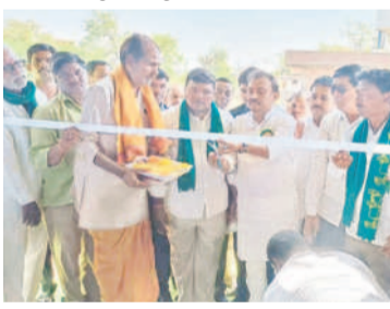
గిడ్డంగిని ప్రారంభిస్తున్న ఎమ్మెల్యే లక్ష్మీకాంతారావు

జిల్లాలో నిర్మించిన 500 మెట్రిక్ టన్నుల సామర్థ్యం గల గిడ్డంగిని బుధవారం ఆయన ప్రారంభించారు. ఆనంతరం ప్రభుత్వ జూనియర్ కళాశాలలో నిర్వహించిన బిచ్చం, ఫిబ్రవరి 21: జిల్లాలో నియోజకవర్గాన్ని అందించేలా అభివృద్ధి చేస్తామని ఎమ్మెల్యే లక్ష్మీకాంతారావు అన్నారు. బిచ్చం మండల కేంద్రంలో రూ.38లక్షలతో రైతు సేవా సహకార సంఘం ఆవర