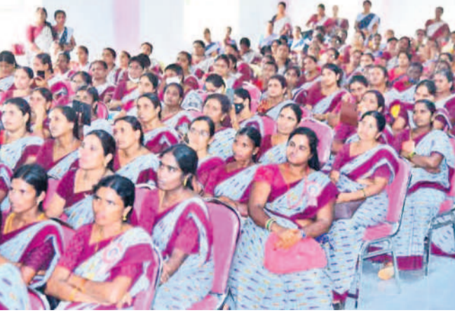
తాళులు అంగన్వాడీలను పూర్తిగా నిర్లక్ష్యం చేశాయి. వేతనాలు పెంచాలని అనేక ఆందోళనలు చేసినప్పటికీ కంటిమడుపుగా వందో.. రెండోవందలో పెంచారు. అవి ఏ మూలకూ సరిపోయేది కాదు. కానీ, కేసీఆర్ సర్కారు వచ్చిన తర్వాత ఆ పరిస్థితి మారింది. కీలక సేవ

కరీంనగర్, ఫిబ్రవరి 21 (నమస్తే తెలంగాణ ప్రతినిధి)/ కల్వరేట్: ఓడెక్కెడాకా ఓడ మట్టన్న.. ఓడ దిగినంత బోడి మట్టన్న అన్నట్టుగా ఉన్నది కాంగ్రెస్ ప్రభుత్వ తీరు. శాసన సభ ఎన్నికలకు ముందు ఇష్టానుసారంగా హామీలు గుప్పించిన ఆ పార్టీ, ఇప్పుడు అమలులో మాత్రం వోడ్లం చూస్తున్నది. తాము అధికారంలోకి వస్తే వేతనాలు పెంచడంతో పాటు ప్రభుత్వ ఉద్యోగులతోపాటి జీతాలు విడుదల చేస్తామంటూ హామీ ఇచ్చింది. తీరా గెలిచిన తర్వాత జీతాలు పెంచడం చెప్పడం లేదు. ఫలితంగా అంగన్వాడీ టీచర్లు, ఆయాలు రెండు నెలలుగా జీతాల కోసం ఎదురు చూడాల్సి వస్తున్నది. నాడు ఆడుతున్న కేసీఆర్ సర్కారు గౌరవాలు, బాధించేటటువంటి పోషికా హారం అందిస్తూ, ఆరోగ్యరక్షణ బాలలకు ఆటా పాటలతో కూడిన పూర్వ ప్రాథమిక విద్యనందిస్తున్నారని అంగన్వాడీలు. అలాగే ప్రభుత్వం నిర్వహించే అనేక కార్యక్రమాల్లో భాగస్వాములవుతారు. అయినా నాటి ఉమ్మడి రాష్ట్ర ప్రభు