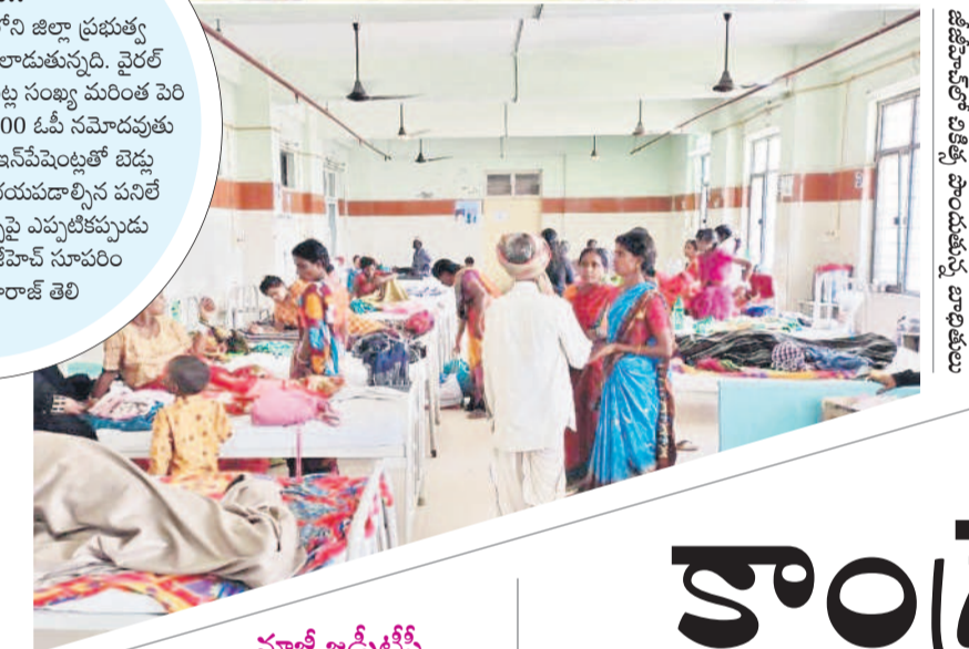
గాంధీ ఆసుపత్రిలో నిర్వహించిన కార్యక్రమం