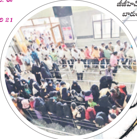
జీజీహెచ్ ఓపీ కౌంటర్ వద్ద బారులుతీలిన రోగులు