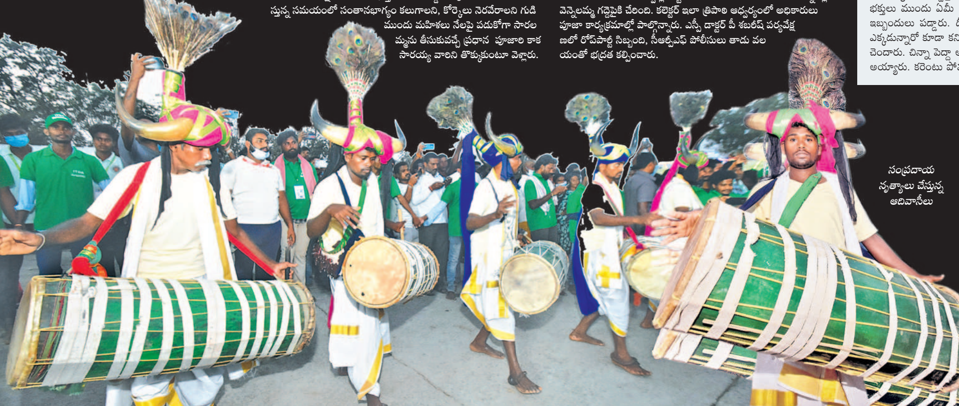
సంప్రదాయ స్మత్యాలు చేస్తున్న అదివాసీలు

అమ్మవారి ప్రతిమను వెదురు బుట్టలో తీసుకొస్తుండగా ఆలయం మెట్ల నుంచి వంద మీటర్ల పొడవునా భక్తులు కింద పడుకొని వరం పట్టారు. పూజారులు వీరిపై నుంచి దాటి వెళ్లారు. సారలమ్మ రాకకు సూచిస్తూ అదివాసీ పూజారులు కొమ్ముబూరలు ఊడారు. ప్రత్యేక డోలి వాయిద్యాలు, శివసత్తుల పూనకాలు, హిజ్రాల శివాలతో సారలమ్మ ఆలయం భక్తితో డిప్లాంగింది. సారలమ్మ నేరుగా గద్దెలపైకి కాకుండా మేడారంలోని సమ్మక్క పూజా మందిరానికి చేరుకుంది. అప్పటికే అక్కడికి గోవిందరాజు, పగిడిద్దరాజులు చేరుకున్నారు. పూజారులంతా కలిసి పూజలు చేసి కట్టు చేసిన అనంతరం సారలమ్మను గద్దెపైకి చేర్చారు. మంత్రి, కలెక్టర్, ఇతర ఉన్నతాధికారులు అమ్మవారికి సాగతం పలికారు. సోలం వెంకటేశ్వర్లు వజ్రీన హనుమంతుడి జెండా నీడలో కన్నెపల్లి వెన్నెలమ్మ గద్దెపైకి చేరింది. కలెక్టర్ ఇలా త్రిపాల ఆధ్వర్యంలో అధికారులు పూజా కార్యక్రమాల్లో పాల్గొన్నారు. ఎన్టీ డాక్టర్ పీ శబరిన్ పద్మవేళ్ల ణలో రోపవాణి నిబ్బంది, నీ ఆర్.ఎస్ పోలీసులు తాడు చలయంతో భద్రత కల్పించారు.