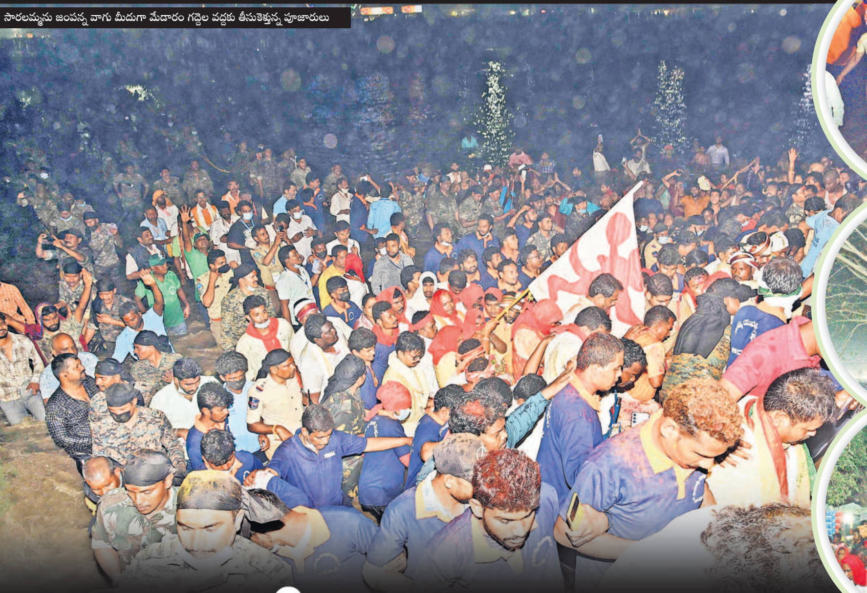
సారలమ్మను జంపన్న వాగు మీదుగా మేడారం గద్దెల వద్దకు తీసుకెళ్తున్న పూజారులు