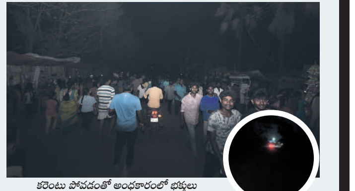
కరెండు పోవడంతో అంధకారంలో భక్తులు