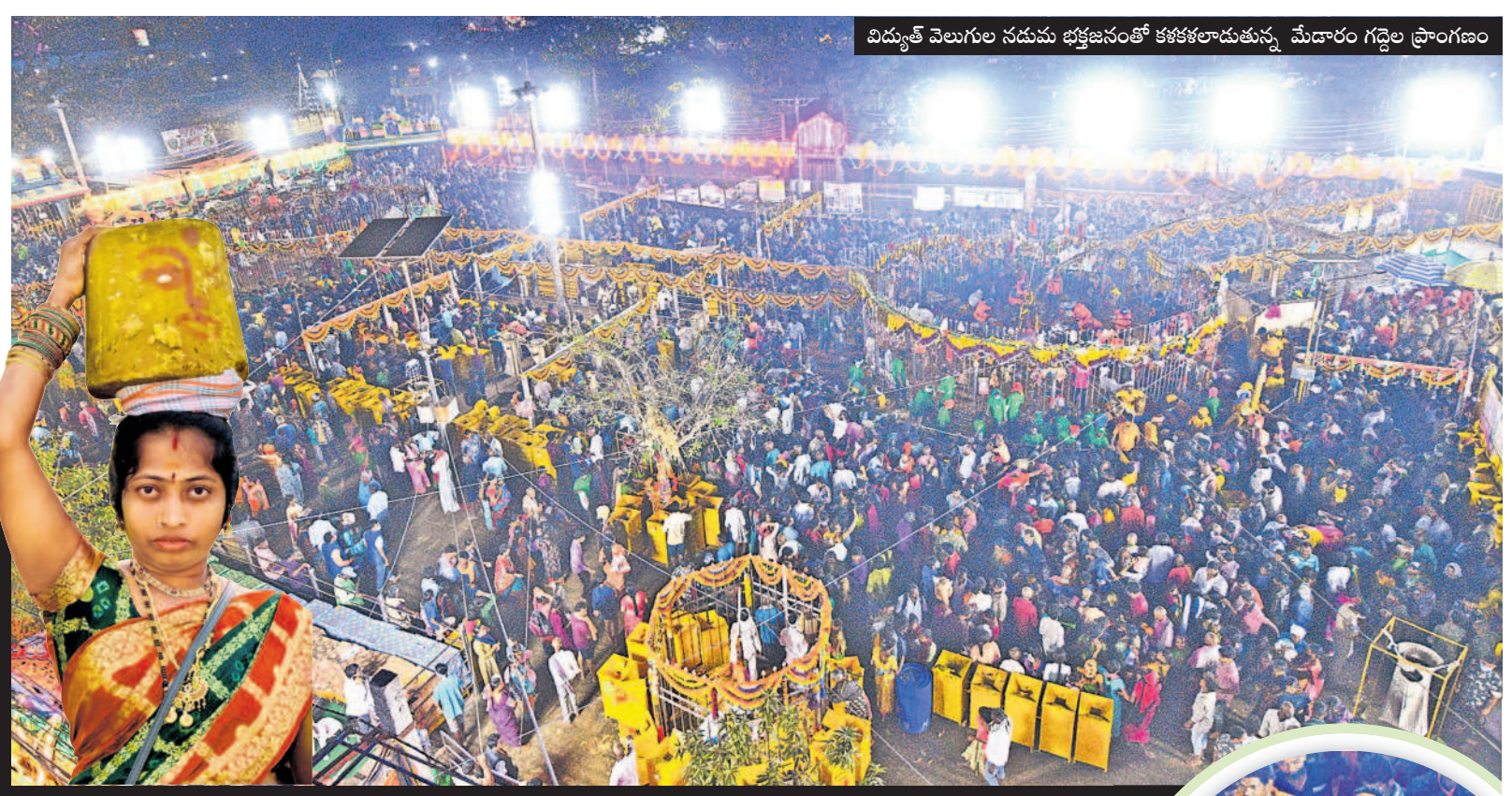
విద్యుత్ వెలుగుల నడుమ భక్తజనంతో కళకళలాడుతున్న మేడారం గద్దెల ప్రాంగణం

వనమంతా జనస్రభంజనం సారలమ్మ గోవిందరాజులు, పగిడిద్దరాజు ప్రతిమలను గద్దెలపైకి వచ్చిన సందర్భంలో మేడారం, కన్నెపల్లి, రెడ్డిగూడెం, జంపన్నవూగు, నార్కాపూర్ పరిసర ప్రాంతాలు భక్తులతో కిక్కిరిసిపోయాయి. భక్తుల పుణ్య స్నానాలతో కిక్కిరిసిపోయాయి. జనంతో చిందిపోయింది. సారలమ్మ గద్దెపైకి రాగానే భక్తులు పరవశంతో దర్శనం కోసం ఒక్కసారిగా గద్దెల వద్దకు వచ్చేందుకు ప్రయత్నించారు. చూడు కిలోమీటర్ల మేర ఏర్పాటు చేసిన క్యూలైన్ల సరిపోక రోడ్డుపై సైతం పరుసల్లో బారులు తీరారు. అంతకుముందు తబ్బల గద్దెలకు పూజారులు అలుకుపూతలు చేశారు. కాక పంఠీయులు సారలమ్మ గుడి నుంచి, మేడారంలోని సమస్త పూజా మందిరం నుంచి పూజారులు వారి కుటుంబ ఆదర్శి ద్వలు పసుపు, కుంకుమలు, పూజా సామగ్రినితో డోలి వాయిద్యాల నడుమ గద్దెల వద్దకు చేరుకొని అలుకుపూతల కార్యక్రమం నిర్వహించారు.