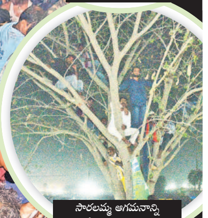
సారలమ్మ ఆగమనాన్ని తిలకించేందుకు వెళ్ళిన భక్తులు