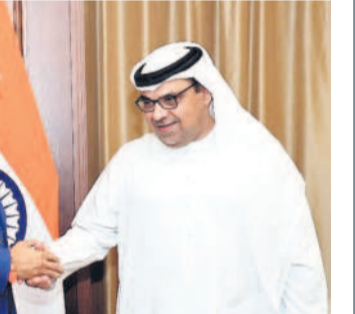
క్రమాధిక్త పెట్టెలా దుబాయి రాజుకు విస్తరించాలని అక్కడి అధికారులను కలిసి కోరుతున్న ఎమ్మెల్యే కేటీఆర్ (మీడి)

మల్లేశం, రవి వద్ద టెక్నిక్ల డబ్బులైతే దుబాయ్ లోనే ఆగిపోగా, విషయం తెలుసుకొని కేటీఆర్ టెక్నిక్ల సమకూరారు. దీంతో ఇద్దరూ బుధవారం తెల్లవారుజామున దుబాయి నుంచి స్వదేశానికి చేరుకున్నారు. అప్పటికే కేటీఆర్ ఆదేశాలతో బీఆర్ఎస్ నాయకులు కుటుంబసభ్యులను అక్కడికి తీసుకెళ్లి, ఆ ఇద్దరినీ ఎయిర్ పోర్టు తీసుకొచ్చారు. ఇంటికి చేరిన మల్లేశం, రవి తమ తల్లిదండ్రులు, కుటుంబసభ్యులను చూసి ఉద్దీగ్గానికి లోనయ్యారు. కొడుకులు, కూతుర్లు, మనుమలను సైతం చూసి పలకరిస్తూ.. ఆలింగనం చేసుకున్నారు. ఇటు తల్లిదండ్రులు 'కొడుకులారా..? మిమ్మల్ని జన్మలో చూస్తామనకొలేదు' అంటూ కంటివడిపెట్టారు. తమ కొడుకులు కేటీఆర్ గారు దయతోనే ఇంటికి చేరారని, ఆ సారు స్వంగా ఉండాలని కోరుకున్నారు. కేటీఆర్ కు కృతజ్ఞతగా గ్రామంలో కుటుంబ సభ్యులు, బంధువులు ఫైర్ కీల్ లు పెట్టారు చేశారు.