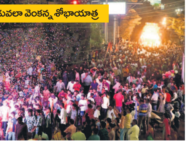
నగరంలో స్వామివారి శోభాయాత్రలో భక్తులు