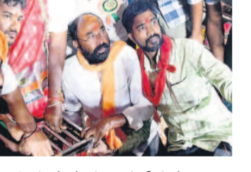
సారలమ్మను గద్దెపై ప్రతిష్ఠిస్తున్న కోయ పూజారులు, భక్తులు