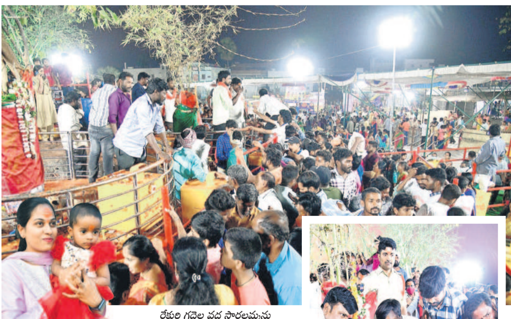
శిశుు గర్భాల వద్ద సారలమ్మను దర్శించుకుంటున్న భక్తులు