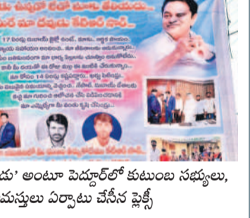
'కేటీఆర్ మాదేవుడు' అంటూ పెద్దపల్లిలో కుటుంబ సభ్యులు, గ్రామస్థులు ఏర్పాటు చేసిన ఫైర్ కీల్