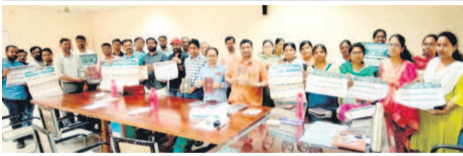
డ్రై. క్యాలెండర్లు విడుదల చేస్తున్న సీనియర్ ఇంజనీర్లు