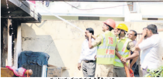
మంటలను చల్లార్చుతున్న ఫైర్ సిబ్బంది