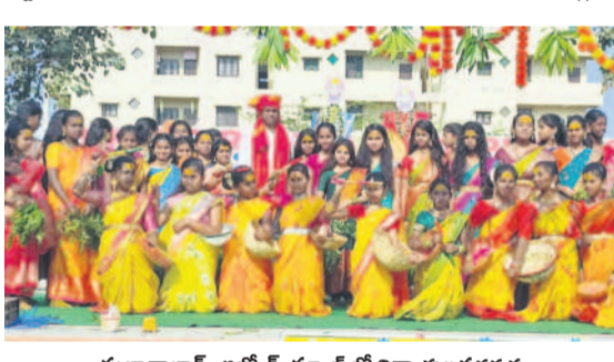
సుల్తానాబాద్ : అల్పార్చి స్కూల్ లో విద్యార్థుల ప్రదర్శన