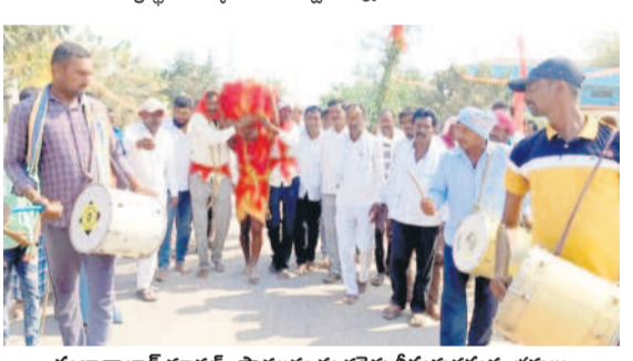
సుల్తానాబాద్ రూరల్ : సారమ్మను గద్దెలకు తీసుకువచ్చున్న భక్తులు