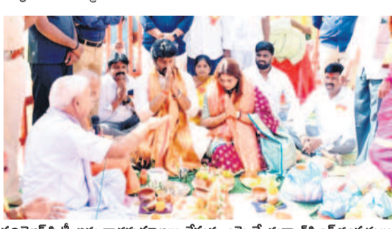
ఫల్లెజిరీ సీటీ: అమ్మవార్ల చూపు ప్రజలకు కొండంత అందం