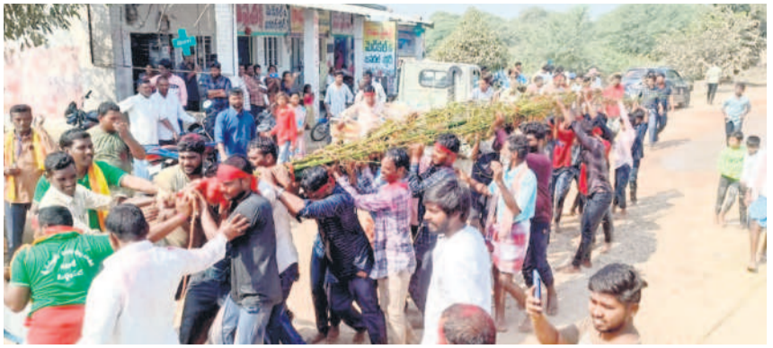
కాల్వత్తిరాంపూర్ : మిడ్లపేట లో సమ్మక్క సారమ్మ గద్దెలకు తీసుకువచ్చున్న కోవనం