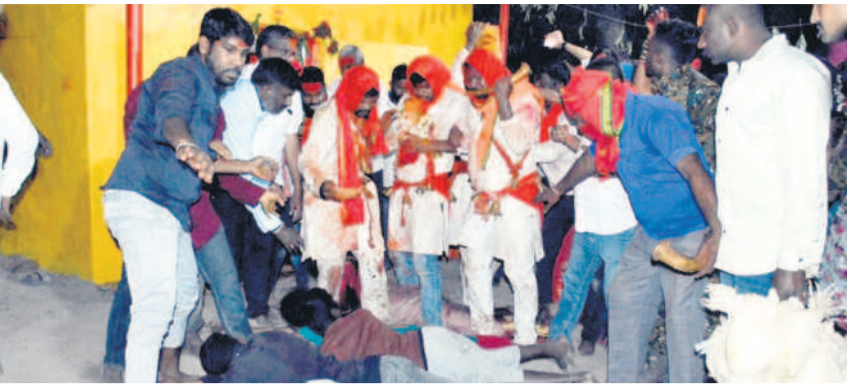
ఫల్లెజిరీ సీటీ : సారమ్మను గద్దెలకు తీసుకువచ్చున్న కోయ పూజారులు