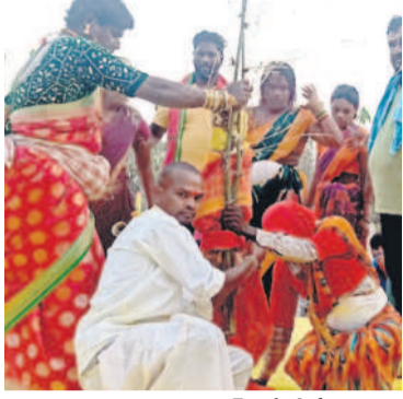
ధర్వారం: అమ్మవారి గద్దెపై ప్రతిష్ఠాస్థాన కోయ పూజారులు