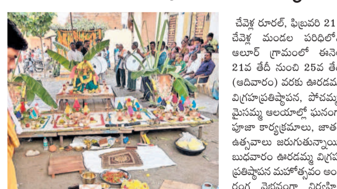
పూజలు చేస్తున్న వందీతులు