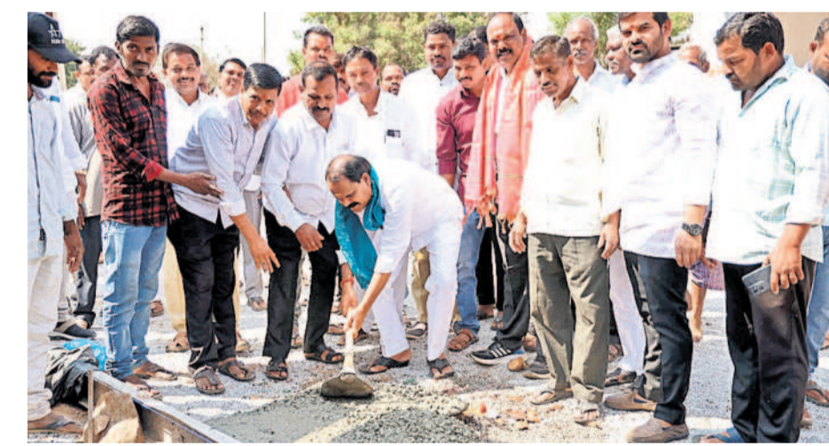
తీర్థాపూర్లో సీసీ రోడ్డు పనులకు ప్రారంభిస్తున్న ఎమ్మెల్యే శంకర్

కొత్తూరు, ఫిబ్రవరి 21: సంక్షేమ పథకాలను పేదలకు చేర్చేందుకు ప్రజాప్రతినిధులు, అధికారులు కృషి చేయాలని షాద్ నగర్ ఎమ్మెల్యే వీరప్ప శంకర్ అన్నారు. ఎంపీటీసీ మధుసూదన్ రెడ్డి ఆధ్వర్యంలో మండల సర్వేసభ్య సమావేశాన్ని బుధవారం నిర్వహించారు. పలువురు ప్రజాప్రతినిధులు గ్రామాల్లో సమన్వయ పనులు చేపట్టారు. ఆనంతరం ఎమ్మెల్యే మాట్లాడుతూ..