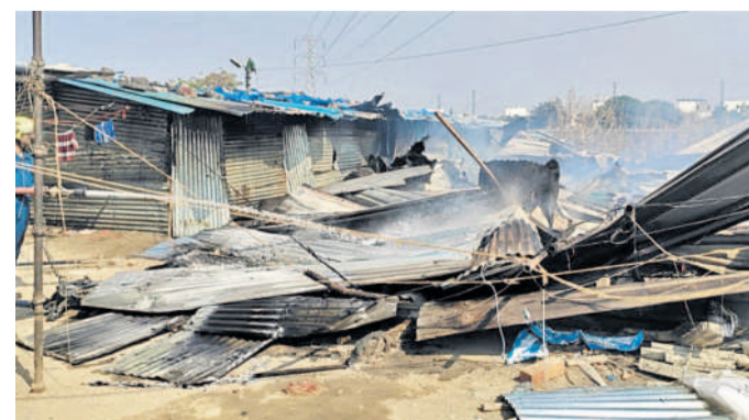
మంటలను అర్చితున్న షైర్ సిబ్బంది