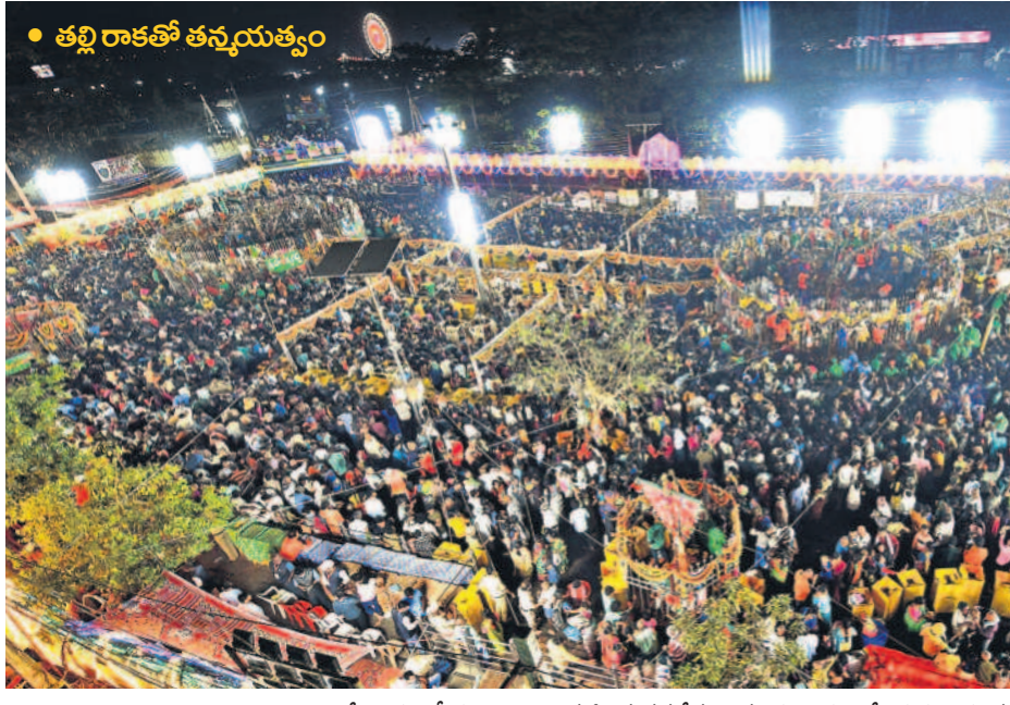
మేడారంలో గద్దెలపై కొలువుదీరిన వనదేవతలను దర్శించుకొనేందుకు తరలివచ్చిన భక్తజనం

ఇది కేటీఆర్ ప్రభుత్వ పాలనకు గీటురాయి. తెలంగాణ గత ఐదేండ్లలో సాధించిన ప్రగతిని అల్లం వెల్లడించిన అంకెలే వివరిస్తున్నాయి. ధ్యాంక్ టు కేటీఆర్ > 3 తెలంగాణ అప్పులకుప్పగా మారడంపై కాంగ్రెస్, బీజేపీ, సోషల్ మీడియా, యూట్యూబ్ వానప్లీ చేస్తున్న ప్రచారం అబద్ధమని ఫోర్స్ట్రైప్ కథనంతో తేటతెల్లమైంది. > 3