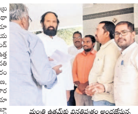
మంత్రి ఉత్తమ్కు వినతిపత్రం అందజేస్తున్న తెలంగాణ గ్రంథాలయ సంఘం ప్రతినిధులు

లేదని గుర్తు చేశారు. దీంతో గ్రంథాల యాల నిర్వహణ ఎంతో ఇబ్బందికరంగా మారిందన్నారు. బ్రాథమిక, మాధ్యమిక పాఠశాలలు, కేజీబీవీ, మోడల్ స్కూళ్లలో గ్రంథాలయాలని ఏర్పాటు చేయాలని విజ్ఞప్తి చేశారు. ఈ కార్యక్రమంలో తెలంగాణ