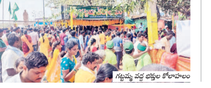
గట్టుపట్టు వద్ద భక్తులు కోలాహలం

వెంకటాపూర్, ఫిబ్రవరి 22: అది దేవత గట్టుపట్టు మేడారం వెళ్లి భక్తులు మొదటి మొక్కులు చెల్లిస్తున్నారు. గురువారం ఉదయం నుంచి సాయంత్రం వేళల్లో భక్తులు తాడి వివరాలను ఉంది. వివిధ ప్రాంతాల నుంచి వచ్చిన ప్రజలు అమ్మవారికి ప్రత్యేక పూజలు చేశారు. ఆయన సమీపంలోని సమృద్ధి-సౌరకృత గడ్డల వద్ద పసుపు, కుంకుమ వేసి మొక్కులు చెల్లించారు. పోలీస్, రెవెన్యూ శాఖ, దేవాలయ శాఖల ఆద్య గ్యారం సౌకర్యాల కలిగి ఉంది.