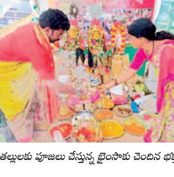
తల్లూల పూజలు చేస్తున్న ఛౌనా చెందిన భక్తులు