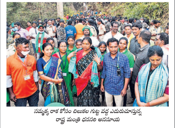
సమృద్ధి రాక కోసం చిలుకల గుట్ట వద్ద ఎదురుమాస్తున్న రాష్ట్ర మంత్రి దనసల అనసూయ