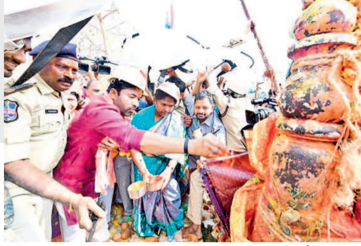
సమృద్ధి గడ్డ వద్ద మొక్కుతున్న కేంద్రమంత్రి కిషన్ రెడ్డి, రాష్ట్ర మంత్రి సీతక్క

ములుగు, ఫిబ్రవరి 22 (సమస్త తెలంగాణ) : రాష్ట్ర విభజన హామీల్లో భాగంగా గిరిజన యూనివర్సిటీని ములుగు జిల్లా కేంద్రంలో ఏర్పాటు చేస్తున్నట్లు కేంద్రమంత్రి కిషన్ రెడ్డి తెలిపారు. అంతర్జాతీయ స్థాయిలో గిరిజన విశ్వ విద్యాలయం కోసం కేంద్ర ప్రభుత్వం రూ.900 కోట్ల నిధులను విడుదల చేసిందన్నారు. గురువారం ఆయన మేడారం మహాజాతరకు హాజరై సమృద్ధి-సౌరకృత దర్శించుకున్నారు. పన దేవతలకు నిలువెత్తు బంగారం సమర్పించి, మొక్కులు చెల్లించుకున్నారు. అనంతరం ఏర్పాటు చేసిన సమావేశంలో కిషన్ రెడ్డి మాట్లాడుతూ... పార్లమెంట్ ఎన్నికల తర్వాత ములుగులో గిరిజన యూనివర్సిటీ భవన నిర్మాణానికి శంకుస్థాపన చేయనున్నట్లు తెలిపారు. రాష్ట్ర