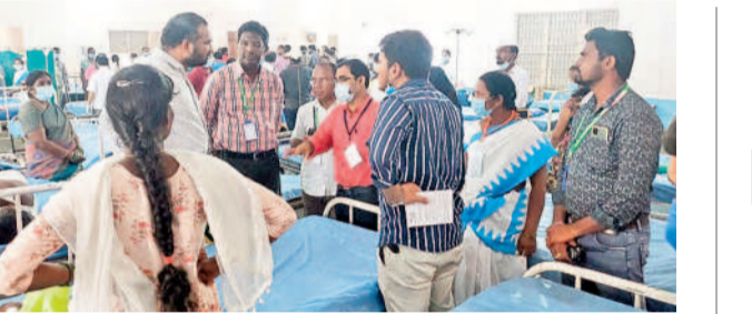
వైద్యశాలలో మాట్లాడుతున్న కర్షణ