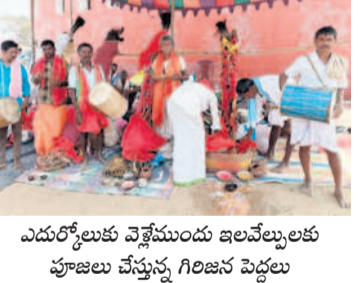
ఎదుర్కోలుకు వెళ్తున్నందు ఇలవేల్పులకు పూజలు చేస్తున్న గిరిజన పట్టణం

ములుగు రూరల్, ఫిబ్రవరి 22 : మేడారం వసదేవతలం నుండి మూలకల వాగ్దానం జరిగింది. పోలీసుల చర్యలను మీడియా ప్రతినిధులు మంత్రి సీతక్క దృష్టికి తీసుకువెళ్లగా పోలీసు అధికారులతో మాట్లాడి చిలుకలగట్టు వరకు పంపారు. తర్వాత మళ్లీ అడ్డకోని ఇద్దరిని మాత్రం పంపించారు. డీవైఎం ప్రతినిధులు పోలీసుల తీరుపై తీవ్రంగా మండిపడ్డారు. సమృద్ధిను గడ్డ వద్దకు తీసుకువచ్చి సమయంలో కూడా రోపిపార్టీ పోలీసులు కఠినంగా ఆటంకం కలిగించారు.