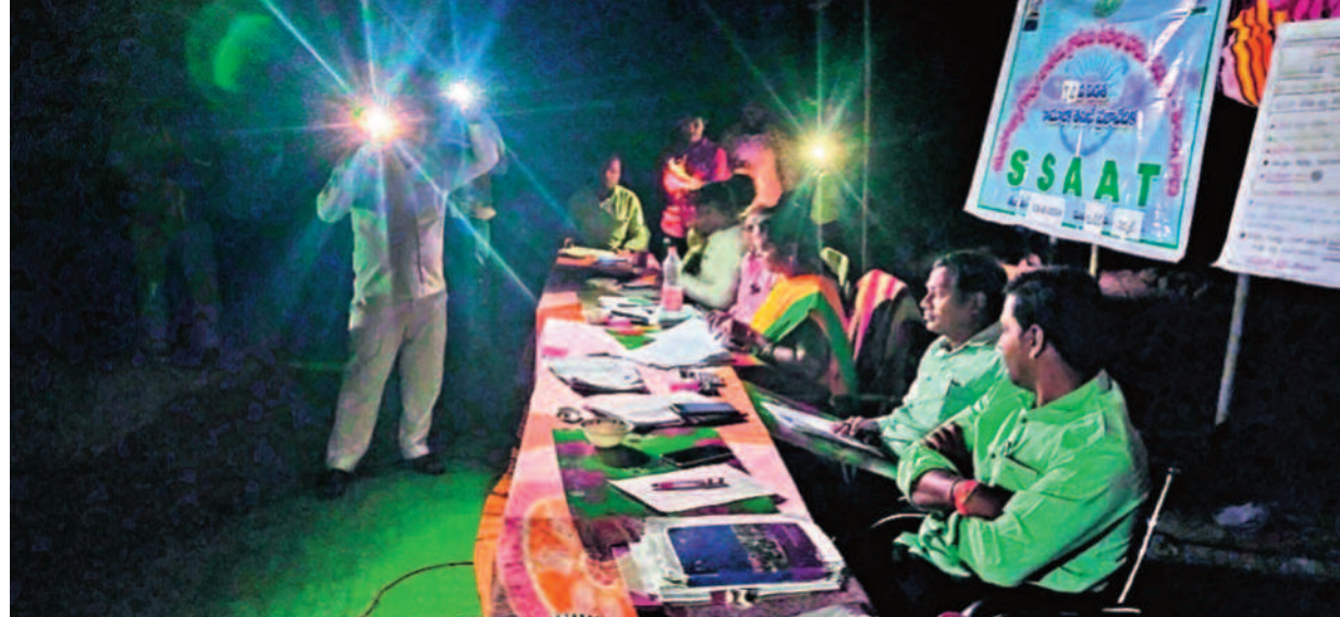
రాష్ట్రంలో అధికారికంగా విద్యుత్తు కోతలు లేవని స్వయంగా సీఎం రేవంత్ రెడ్డి ఓ వైపు చెప్పినా మరోవైపు కరెంటు కోతలు కొనసాగుతూనే ఉన్నాయి. కరెంట్ కట్ వేస్తే నాళర ఉండదని సీఎం హెచ్చరించిన కొన్ని గంటల్లోనే నిర్వల్ జిల్లాలో ఓ అధికారిక కార్యక్రమాన్ని చీకట్లో నిర్వహించుకొంటూ వచ్చింది. కుభీర మండల వలసత్తు కార్యాలయంలో శుక్రవారం నిర్వహించిన ఈజీఎస్ సామాజిక తనిఖీ రాత్రి 8.15 గంటల వరకు కొనసాగింది. తరచూ కరెంటు పోవడంతో సెల్ ఫోన్లు వెలుతురులో ప్రజావేదికను కొనసాగించారు.

జర్నలిస్టు సంకర్షణ దాడి.. ఇద్దరి అరెస్ట్ శంకర్ సు పరామర్శించిన బీఆర్ఎస్ నేతలు తెలంగాణలో ఎమ్మెల్యే మొదలైంది : కేటీఆర్ > 8 13 తర్వాత లోక్ సభ షెడ్యూల్! ఎన్నికల్లో ఏవ వినియోగం కేంద్ర ఎన్నికల వర్గాల వెల్లడి > 7