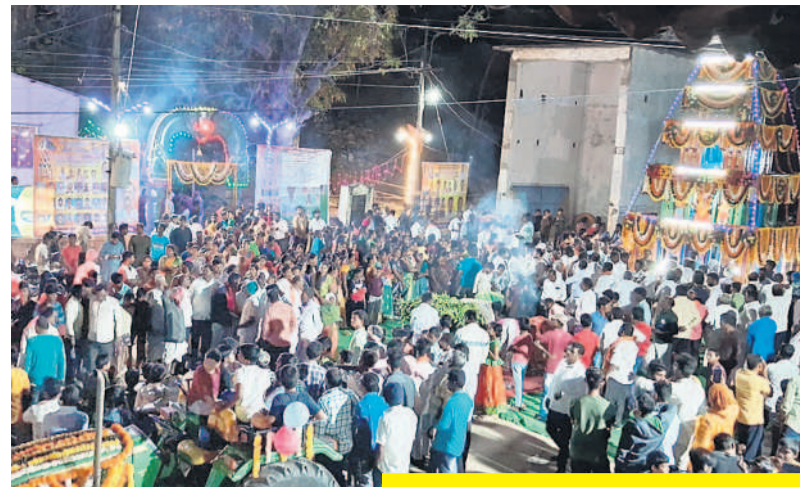
కనుల పండువగా రథోత్సవం