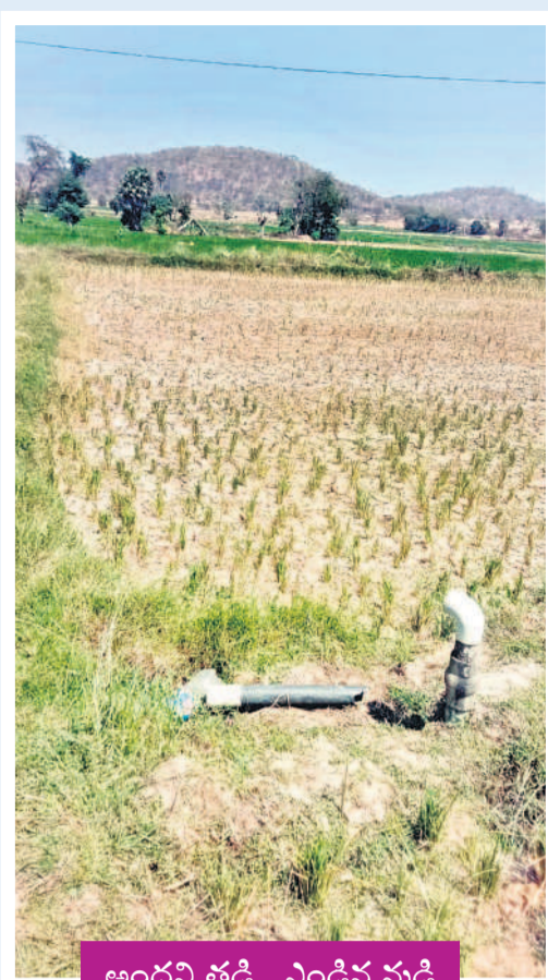
అందని తడి.. ఎండిన మడి