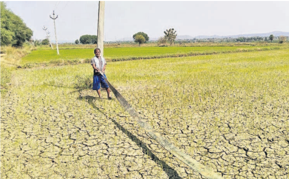
నీళ్లు కోసం పొలంలో పైపు వేస్తున్న రైతు