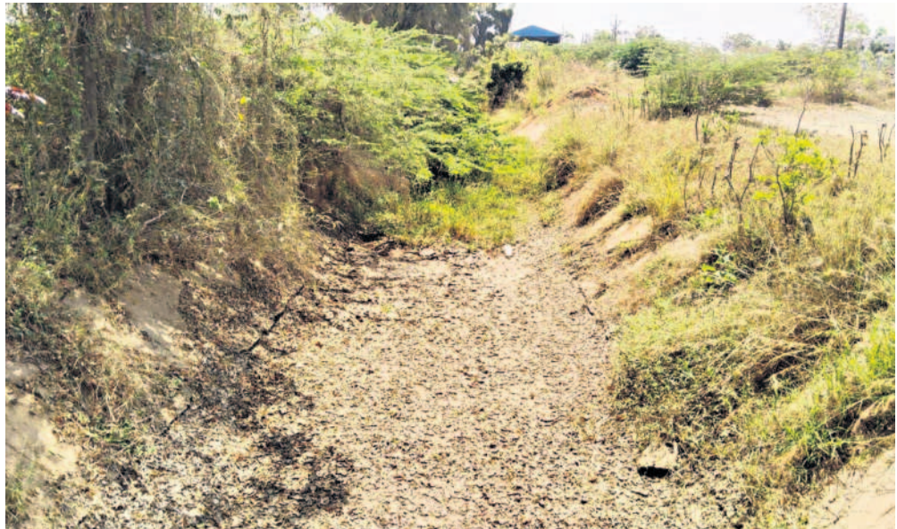
నీళ్లు లేక ఎండిపోయిన కాల్వ