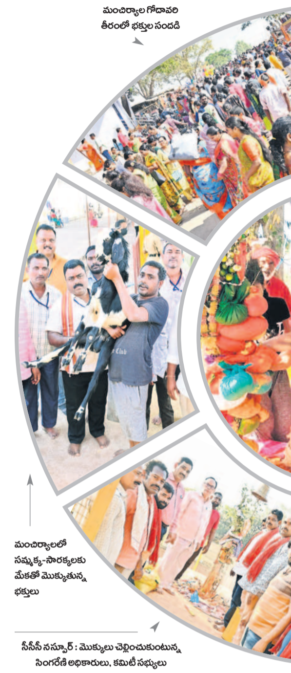
మంచెలయ్యల గోదావరి తీరంలో భక్తుల సందడి