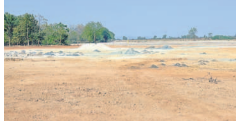
రంగంపేట శివారులో వెలసిన అక్రమ వెంచర్

మంచెలయ్యల, ఫిబ్రవరి 23 (నమస్తే తెలంగాణ ప్రతినీడి) : మంచెలయ్యల జిల్లా కేంద్రంలోని రంగంపేటలో అక్రమ వెంచర్ వెలసింది. మంచెలయ్యల మున్సిపల్, ఇరిగేషన్, రెవెన్యూ అధికారుల కంప్లెక్స్ కింద మంచెలయ్యల పేరిట రే-అవుట్ ఏర్పాటు చేయడం విమర్శించుతూ తా విన్నవించింది. మంచెలయ్యల మున్సిపాలిటీ పరిధి లోని రంగంపేట శివారులో సర్వే నంబర్ 58, 68, 69లోని 8 ఎకరాలలో ఈ రే-అవుట్ ను ఏర్పాటు చేశారు. ఇక్కడికి వెళ్లడం రంగంపేట చిన్నకుంట చెరువు కట్ట మీదుగా రోడ్డు వేశారు. ఇరిగేషన్ శాఖ నుంచి ఎలాంటి అనుమతులు తీసుకోకుండా ఓ పక్కన కట్టను తొలిచి వెంబడి దాకా సుమారు రెండు కిలోమీటర్ల వరకు రోడ్డు వేశారు. చెరువు పక్కనుంచి వెంబడి వరకు వెళ్లే ఎడ్లబండ బావి (ప్రభుత్వ భూమి)ను 30 ఫీట్ల రహదారిగా మార్చేశారు. స్థానికంగా ఇది పెద్ద చర్చనీయాంశం అయినప్పటికీ అధికారులు తమకు ఏం తెలియదని సమాచారాలు చెబుతున్నారు. అధికారులకే తెలిసి ఇదంతా జరిగిందని స్థానికులు ఆరోపిస్తుంటే... మీరు చెప్పే దాకా తమ దృష్టికి రాలేదని ఆయా శాఖల అధికారులు జిల్లా కమిషనరుకు సమస్యలు చేయడం పలు అనుమానాలు తావిస్తున్నాయి. గతంలో జిల్లాలో మండలంలో అవర్ (డ్రీమ్ ప్రాజెక్ట్ పేరుతో ఇండ్లు నిర్మించిన సంస్థ... ఇక్కడ శ్రీరంగం హిల్స్ పేరుతో సుమారు 150 ఫ్లాట్లతో ఈ వెంచర్ ను ఏర్పాటు చేసింది. పేరు గొప్ప... ఊరు దిబ్బ అన్న రీతిలో 'అవర్ డ్రీమ్' అనే పేరు చెప్పి ఆ సంస్థ నిర్మాణాలు అక్రమాలకు తెరలేపారనేది తెలుస్తున్నది.