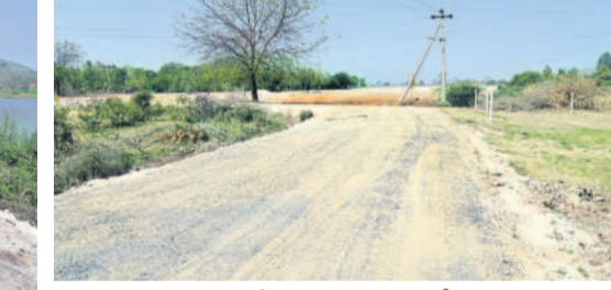
వెంచరుకు వెళ్లడం కుదిరిన 30 ఫీట్ల రోడ్డు (ఇది వ్యవసాయ పాఠశాలకు వెళ్లడం కుదిరినది కాదు)