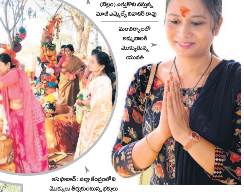
మంచెలయ్యలలో అమ్మ వాడగు మొక్కలు తీర్చుకున్న భక్తులు