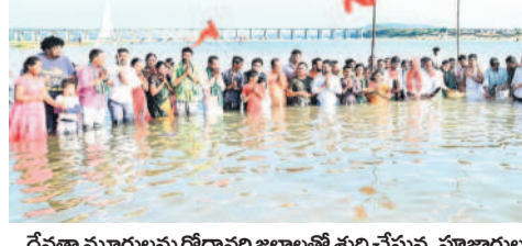
దేవాలయ మూర్తులను గోదావరి జలాలలో స్నానం చేస్తున్న పూజారులు, నాయకపోడి వంశస్థులు