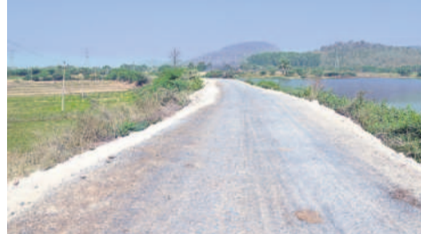
రంగంపేట చిన్నకుంట చెరువు కట్ట మీదుగా వేసిన రోడ్డు

మూడెకరాలకు నాలుకా కన్వర్షన్.. మున్సిపాలిటీ పరిధిలోని ఏ రే-అవుట్ పట్టికలోని టీపీ (టింటిటిపీ లే-అవుట్ పట్టిక) తీసుకోవాలి. అది పచ్చాకే ప్లాట్లు, రోడ్డు ఇతర డెవలప్ మెంట్ పనులు చేసుకోవాలి. కానీ,