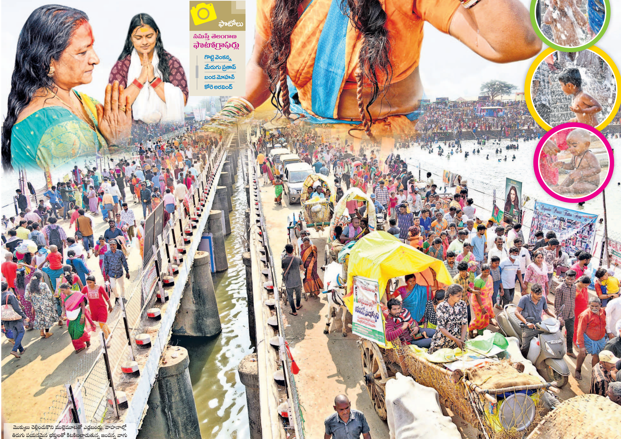
మొక్కులు చెల్లించుకొని ముల్లెమూటతో ఎడ్లబండ్లు, వాహనాల్లో తిరుగు పయనమైన భక్తులతో కిటకిటలాడుతున్న జంపన్న వారి

నమిస్తే తెలంగాణ ఫోటోగ్రాఫర్లు గొట్టి వెంకన్న మేరుగు ప్రతాప బండ మోహన్ కోరే లరవింద