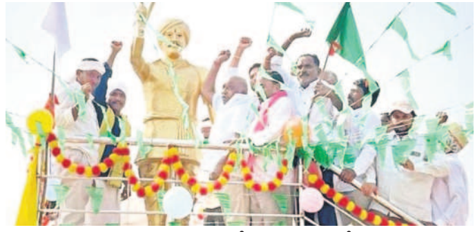
జైతుపుంజం లంటూ నివాసాలు చేస్తున్న మాజీ మంత్రి జోగు రామన్న