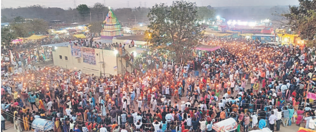
అలయం చుట్టూ సజ్జకుండలను ఎత్తుకుని ప్రదర్శింపా చేస్తున్న భక్తులు

వార్డులు ఉండగా పునర్నిర్మాణంలో భాగంగా ఆదిలాబాద్ రూరల్, మావల మండలంలోని పలు గ్రామాలను విలీనం చేయడంతో వార్డుల సంఖ్య 49కి పెరిగింది. బల్దియా పరిధి పెరగడంతో జనం తాకిడి అధికమైంది. దీంతో కొత్త భవనం నుంచి సేవలు ప్రారంభమయ్యాయి. రెండో అంతస్తులో ఇంజనీరింగ్ విభాగాలు, అకౌంట్స్, మెట్రా, శానిటరీ సెక్షన్లు సంబంధించిన గదులు ఉంటాయి. మూడో అంతస్తులో మున్సిపల్ సర్వేసభ్య సమావేశాలు, వీడియో కన్ఫరెన్స్ గదులను నిర్మించారు. పాత భవనం నుంచి వివిధ శాఖల విభాగాలను సంబంధించిన పర్సనల్, ఫైల్స్, కంప్యూటరీలను కొత్త భవనంలో తరలించారు. భవనానికి బయట రంగులు వేయడానికి ఏర్పాటు చేస్తున్నారు.