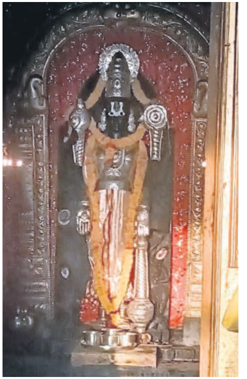
లక్ష్మీనారాయణ స్వామి పాదాలను తాకిన సూర్య కిరణాలు