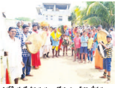
జాతరగోపురం భీమన్న గజాలతో ముదిరాజు కమిటీ సభ్యులు