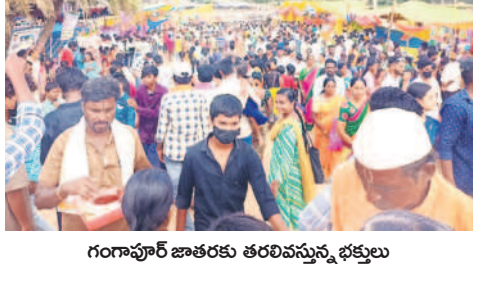
గంగాపూర్ జాతరకు తరలివస్తున్న భక్తులు