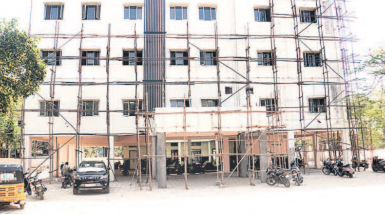
కొత్త మున్సిపాలిటీ భవనం

ఆదిలాబాద్, ఫిబ్రవరి 24(నమస్తే తెలంగాణ) : పట్టణంలోని వినాయక్ చౌక్ ప్రాంతంలో గల పాత మున్సిపాలిటీ ఎదురుగా నిర్మించిన నూతన బల్దియా భవనం అన్ని హంగులతో నిర్మాణం పూర్తి చేసుకున్నది. పాత భవనం పగుళ్లు తేలడంతోపాటు ప్రజలకు మెరుగైన సేవలు అందించడానికి కేసీఆర్ ప్రభుత్వం కొత్త భవనాన్ని నిర్మించింది. గతంలో మున్సిపాలిటీలో 38