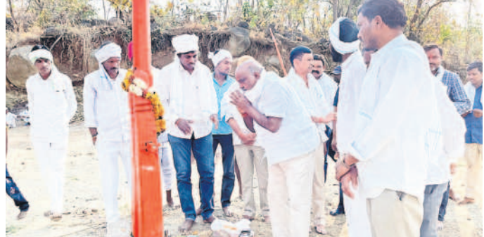
వాన్కాట్ గ్రామంలో హిరానుక చిత్రపటం వర్ణ పూజలు చేస్తున్న మాజీ మంత్రి రామన్న

- నిర్మల్ కలెక్టర్ ఆశీష్ సంగన్న నిర్మల్ టౌన్, ఫిబ్రవరి 24 : పది, ఇంటర్ పరీక్షలను పక్కంబీగా నిర్వహించాలని కలెక్టర్ ఆశీష్ సంగన్న ఆదివారం అడిగారు. శనివారం కలెక్టర్ కార్యాలయంలో పరీక్షల నిర్వహణపై సమావేశం నిర్వహించారు. ఈ సందర్భంగా ఆదివారం కలెక్టర్ కార్యాలయంలో పరీక్షల ప్రారంభం కానుండగా.. 23 కేంద్రాలను ఏర్పాటు చేశామని తెలిపారు. 13,845 మంది విద్యార్థులు హాజరయ్యారని తెలిపారు.