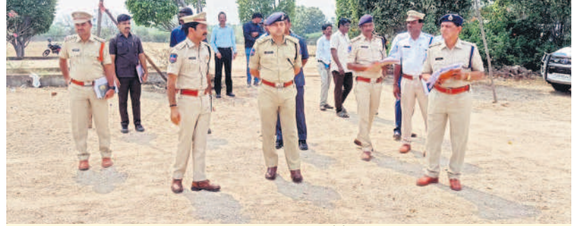
సఖా స్థలాన్ని పరిశీలిస్తున్న సైబరాబాద్ సీపీ అవినాశ్ మహాంతి

చేపేటలో, ఫిబ్రవరి 24 : ఈ నెల 27న చేపేటలోని పూర్వ ఇంజనీరింగ్ కళాశాల వద్ద కౌన్సిల్ ప్రభుత్వం భారీ బహిరంగ సభ నిర్వహించనున్నది. ఈ సభకు సంబంధించి ఏర్పాట్లు, స్థలాన్ని శనివారం రంగారెడ్డి కలెక్టర్ శశాంక, సైబరాబాద్ సీపీ అవినాశ్ మహాంతి, రాజేంద్రనగర్ డి.సీపీ శ్రీనివాస్, చేపేట ఏ.సీపీ కిషన్ బాబు వేర్వేరుగా అధికారులతో కలిసి పరిశీలించారు. సఖా స్థలంలోనే ఉన్న హెలికాప్టర్ ల్యాండ్లింగ్ స్థలాన్ని, వారు పరిశీలించారు. అనంతరం సీపీ సభ స్టేజీ, కళా