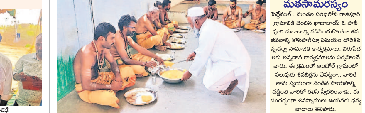
మతసామరస్యం పెద్దేమర్ : మండల పరిధిలోని గాజీపూర్ గ్రామానికి చెందిన భాజాబాయ్ ఓ పానీ హూరి దుకాణాన్ని నడిపించుకొంటూ తన జీవనాన్ని కొనసాగిస్తూ సమయం దొరికినప్పుడల్లా సామాజిక కార్యక్రమాల, నిరుపేదలకు అన్నదాన కార్యక్రమాలను నిర్వహించే వారు. ఈ క్రమంలో ఇండోర్ గ్రామంలో పలువురు శివశిష్యులు చేపట్టారు.. బాలిక తాను స్వయంగా వండిన పాయసాన్ని వడ్డించి బాలికల కలిసి స్వీకరించారు. ఈ సందర్భంగా శివసాములు అయినకు ధన్యవాదాలు తెలిపారు.

రంగారెడ్డి జిల్లా అదనపు కలెక్టర్ భూపాల్రెడ్డి, సఖా పూర్ణ నిర్వహించేందుకు సంబంధిత శాఖల అధికారులు అన్ని చర్యలు తీసుకోవాలని రంగారెడ్డి జిల్లా అదనపు కలెక్టర్ భూపాల్రెడ్డి తెలిపారు. శనివారం జిల్లా సమీక్షల కార్యాలయ సమన్వయ భవనంలోని సమావేశం ముగిసిన తర్వాత సఖా పూర్ణ నిర్వహణపై వివిధ శాఖల అధికారులతో సమన్వయ సమావేశం నిర్వహించారు. ఈ సందర్భంగా అదనపు మాట్లాడుతూ.. పదో తరగతి పరీక్షలను ఎటువంటి సమస్యలు తలెత్తకుండా నిర్వహించాలని సూచించారు. మార్చి 18 నుంచి ఏప్రిల్ 2 వరకు ఉదయం 9:30 నుంచి మధ్యాహ్నం 12:30 గంటల వరకు నిర్వహించనున్నట్లు తెలిపారు. జిల్లాలో 237 పరీక్ష కేంద్రాల్లో 50,946 మంది విద్యార్థులు పరీక్షలకు హాజరవుతున్నట్లు పేర్కొన్నారు. ప్రాథమికశాఖలకు ప్రధాన పరీక్షలు 37 పోలీస్ స్టేషన్లను గుర్తించారు తెలిపారు. పరీక్ష కేంద్రాల్లోకి మొబైల్, వాట్, ఎలక్ట్రానిక్ వస్తువులను అనుమతించకూడదని చెప్పారు. పరీక్ష కేంద్రాల వద్ద 144 సెక్షన్ విధించి పోలీసు బందోబస్తు ఏర్పాటు చేయాలని తెలిపారు. పరీక్ష