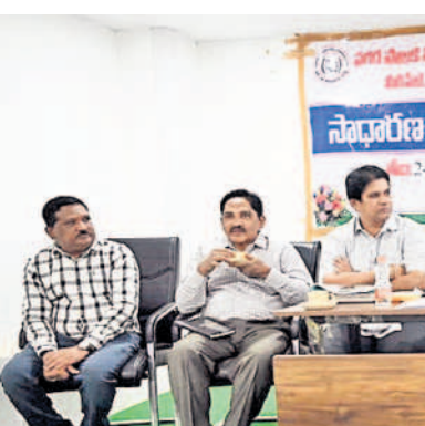
మీర్పేట కౌన్సిల్ సమావేశంలో మాట్లాడుతున్న మాజీ మంత్రి, ఎమ్మెల్యే సబితా ఇంద్రారెడ్డి