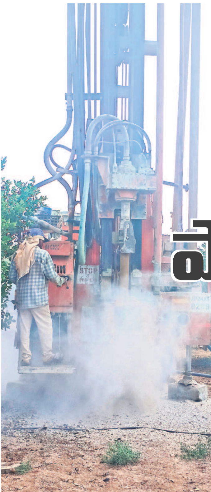
450 ఫీట్ల బోర్ వేసినా నీళ్లు పడుతలేవు

గతంలో ఎన్నో కార్పొరేషన్ లో మంజూరైన కనాం ఫేజి 1.10 ఎకరాల్లో వేసిన బజ్జాయి తోట పెట్టిన. అప్పుడు వేసిన బోరు ఇప్పుడు పట్టిపోయింది. నీళ్లు లేక చెట్లెంబి పరిస్థితి దాపురించింది. ఇన్వెంట్లలో ఇంకా సాగు నీటి ఇబ్బందులు ఎప్పుడూ చూడలేదు. చెట్లను కాపాడు కోవాలని తోటలో ఇంకో బోరు వేయిస్తున్నా. మా ఊళ్లో 450 ఫీట్ల బోరు వేయించినా నీటి జాడ దొరుకుతలేదు. ఇంక బిచ్చం పెట్టి బోరు వేస్తున్నా నీళ్లు పడుతాయనే నమ్మకం లేదు. తోటను దేవుడి కాపాడాలి.