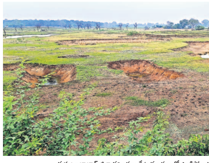
మహబూబాబాద్ జిల్లా నల్లంబలపేట మండలంలో ఎండిపోయిన పెద్దనాగారం చెరువు

భూగర్భ జలాలు పడిపోతుండడంతో నిన్నుమొన్నటి వరకు నిండగా పోసిన బోరుబావులు ఇప్పుడు మొరాయిస్తున్నాయి. పదుల సంఖ్యలో, వందల ఫీట్లలో బోర్లు వేయడం, నీటి ఊటలేక అవి ఎందుకూ కొరగాకుండా పోవడం పరిపాలనా చూరింది. అర ఎకరా, ఎకరా సాగుచేయడమే గగనంగా మారింది. గత ప్రభుత్వం క్రమంగా చెరువులను నింపడం ద్వారా 30 లక్షల బోర్లు కింద దాదాపు 45 లక్షల ఎకరాలకు ఎలాంటి ఇబ్బంది లేకుండా సాగునీరు అందింది. ప్రస్తుతం ఆ ఆయకట్టు పరిస్థితి ప్రస్తావనగా మారింది. అందులో సగం కూడా పండని దుస్థితి క్షేత్రస్థాయిలో నెలకొనడంతో రైతులు దిక్కుతోపని స్థితిలో పడి పోయారు. చేతికొచ్చిన పంటను కాపాడుకునేందుకు రైతులు నానా తంటాలు పడుతున్నారు.