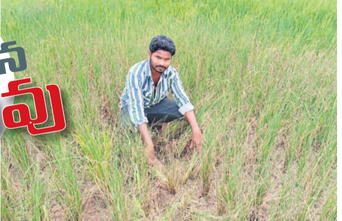
నీళ్లు ఇడిసిపట్టలేదు.. సేను ఎండిపోయింది

మాకు మూడెకరాల వ్యవసాయం ఉన్నది. ఇండ్ల ఎకరంపై వరి సేనుపెట్టిన. ఎండకాలం నీళ్లు ఎల్లులు అని ముందుగానే అనుకుని సగమే పెట్టిన. 30 వేలదాక పెట్టుబడి పెట్టిన. పోయినసారి కూడా పరి ఎండి పోయేట్టు ఉండే. ఆర పల్లి సెరువులకు నీళ్లు ఇడిసిపెట్టేది. ఈసారి నీళ్లు ఇడిసిపెట్టలేదు. మా సేను అంతా ఎండిపోయింది. మడి ఎసుక మడి ఎందుకుంటున్నాయి. రోజుకు గంట నీళ్లు ఎల్లు తున్నాయి. నక్కగ పాలం పారుతలేదు. పల్లెచెరువులకు నీళ్లు ఇడిసిపెడుతారు.. బాయిలు ఉబ్బుతుంటే అని అనుకున్నం. కానీ ఇడిసిపెట్టక పోయింది.