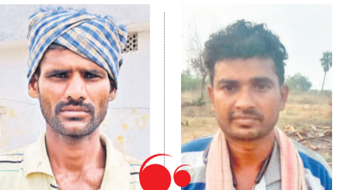
బద్దేండ్ల సంది ఎప్పుడు ఇట్లా చూడలే

40 శాతానికిపైగా ఇతర మార్గాల ద్వారానే రీచార్జ్ కృష్ణా బేసిన్లోని ప్రాజెక్టులకు అశించిన స్థాయిలో నీరు రాకపోవడం, గోదావరి బేసిన్లో నీరు సాగు చేరువులను నింపకపోవడం, కాలువల ద్వారా నీటిని పూర్తిస్థాయిలో అందించక పోవడమే భూగర్భ జలమట్టం పడిపోవడానికి అంతంతమాత్రంగానే ఉంది. చాలా జిల్లాల్లో నీళ్లు లేకపోవడంతో రైతులు బోరుబావులపై ఆధారపడుతుండడంతో భూగర్భ జలాలు వేగంగా తరిగిపోతున్నాయి. 2019లో కాళి శృంగం ప్రాజెక్టు అందుబాటులోకి వచ్చిన నాటి