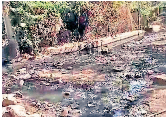
అక్కడే డ్రైనేజీ పొంగి దుర్గం భరితంగా మారిన ప్రదేశాలు

పట్టణమేకటిందే లేదని వారు పేర్కొన్నారు. డ్రైనేజీని సరిచేసి రోడ్డు చేయాలని స్థానికులు కోరుతున్నారు.