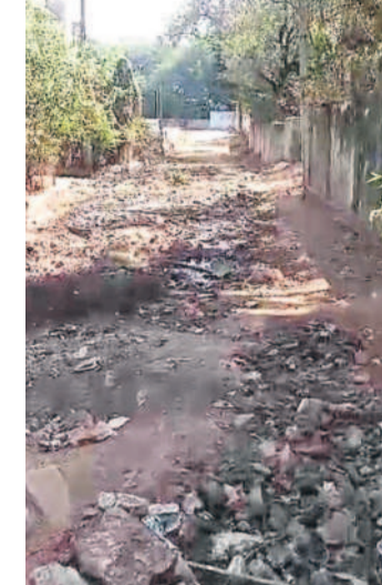
ఓర్డర్ పాటిగడ్డలో రోడ్డు వేయాలన్న ప్రదేశం

బేగంపేట్, ఫిబ్రవరి 26 : నిధులు ఉన్నాయి.. పనుల్లో అలసత్వం కనిపిస్తోంది. అధికారుల నిర్లక్ష్యంతో స్థానికులు సమస్యలతో సతమతమవుతున్నారు. అయినా అధికారులు, ప్రజాప్రతినిధులు పట్టణమేకటిందే లేదు. వివరాల్లోకి వెళ్తే.. నాలుగు నెలల త్రితం అనగా కేబినెట్ ప్రభుత్వ హయాంలో బేగంపేట్ డివిజన్ ఓర్డర్ పాటిగడ్డ ప్రభుత్వ దావాఖాన సమీపంలో రోడ్డు వేసేందుకు రూ.13 లక్షలు మంజూరు చేశారు. అయితే ఆ పనులు వేవేడంలో నిర్లక్ష్యం సృష్టించి కనిపిస్తున్నది. స్థానిక ప్రజా ప్రతినిధులు అధికారులకు సూచించినప్పటికీ పట్టణమేకటి వేకటి లేదని విమర్శలు వినిపిస్తున్నాయి. బేగంపేట్ సర్కిల్లోని బేగంపేట్, రాంగోపాల్పేట్, మోండా మార్కెట్, బస్స్ టాప్ డివిజన్ లో ఆయా అభివృద్ధి పనులకు గాను గత ప్రభుత్వ హయాంలో తీసుకెళ్లగా వారు అధికారులకు చెప్పినప్పటికీ