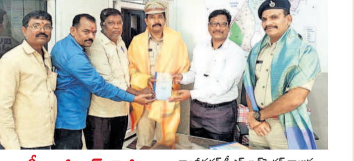
ఎస్సీఆర్సీఎస్ డైరీ, క్యాంటిన్ అందజేత

బంజారాహిల్స్, ఫిబ్రవరి 26 : హాస్టల్ గదిలో నుంచి ల్యాండ్ లాండ్ మాయమైన పుటల ఫిలింగ్ గిఫ్ట్ పరిధిలో చోటు చేసుకున్నది. వివరాల్లోకి వెళ్తే.. బంజారాహిల్స్ లో 12.00 నుండి 12.30 వరకు పూజలు, ధృజ స్తంభానికి పుష్పాదివాసము, ఫలాదివాసము, శరణాధివాసము ఉంటాయని తెలిపారు. 29న ఉదయం 6 గంటలకు మండపం పూజలు 10 గంటలకు ధృజ స్తంభం ప్రతిష్ఠాపన, బలినివేడ, పూర్ణాహుతి, కుంభాభిషేకం, అన్నదాన కార్యక్రమాలు ఉంటాయని చెప్పారు.