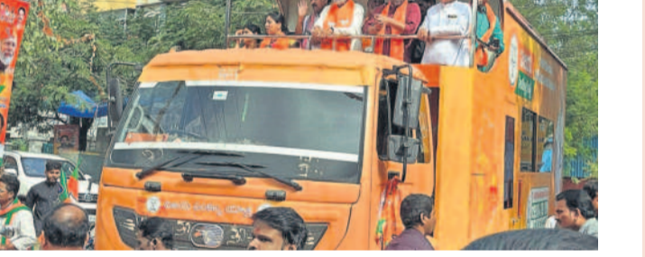
పద్మావతి నగర్లో 'విజయ సంకల్ప యాత్ర'ను ప్రారంభించిన బీ.కిషన్ రెడ్డి, దాక్షర్ కే.లక్ష్మణ్లు

'విజయసంకల్ప యాత్ర'లో బీజేపీ రాష్ట్ర అధ్యక్షుడు కిషన్ రెడ్డి