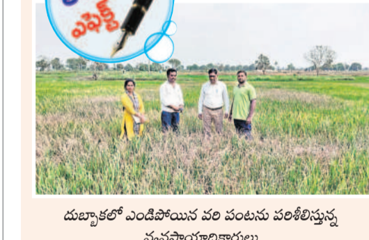
దుర్గాపల్లో ఎండిపోయిన వరి పంటను పరిశీలిస్తున్న వ్యవసాయాధికారులు