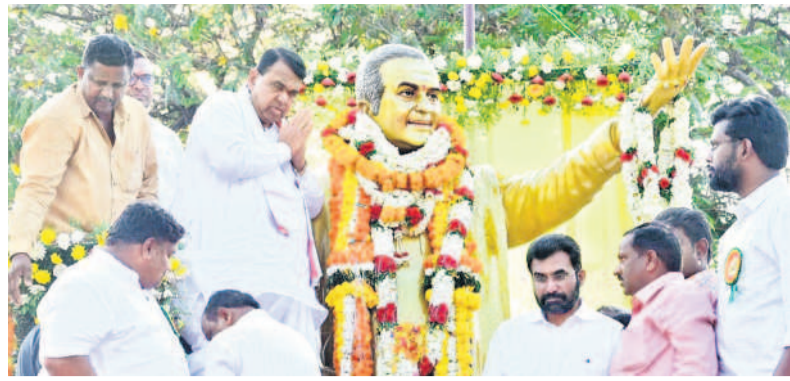
కోటిగిరిలో ఎన్టీఆర్ విగ్రహానికి పూలమాల వేసి నివాళులర్పిస్తున్న మాజీ సీకర్ పోచారం