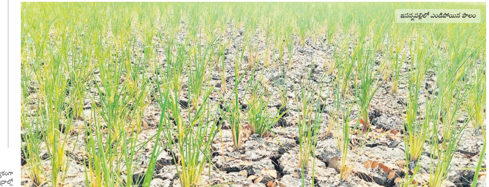
ఇసన్నపల్లిలో ఎండిపోయిన పొలం