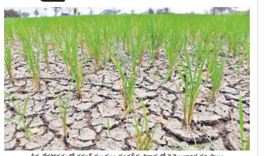
నీళ్లు లేకపోవడంతో ధర్మార మండలం మార్కెట్ శివారులో నెర్రెలుబాలన పరి పొలం

గద్దాల, ఫిబ్రవరి 26 : వానకాలం పంట కన్నీళ్లను మిగల్చగా కోటి ఆశలతో యాసంగి సాగుకు సిద్ధమవుతున్న రైతు ఆశలు ఆవిరయ్యాయి. జిల్లాలో రిజర్వాయర్లు, చెరువుల్లో నీరు లేకపోవడంతో భూగర్భజలాలు తగ్గాయి. దీంతో బోరుబావుల్లో నీటి లభ్యత మందగించడంతో అన్నదాతకు ఏమీ చేయలేక పాలుపోవడం లేదు. ఈ ఏడాది జూరాల, ఆద్వి, తుమ్మిళ్ల తీర్థ కింద రిజర్వాయర్లలో నీరు లేని కారణంగా అధికారులు క్రాపి హాల్డిడ్ ప్రకటించారు. బోర్ల కింద అయినా పంటలు సాగు చేసుకుందామంటే నీటి లభ్యత తగ్గడంతో రైతులు యాసంగికి అనుకున్న స్థాయిలో సిద్ధం కాలేదు. 2020 నుంచి 2022-2023 వరకు ప్రతి ఏడాది జిల్లాలో యాసంగి సాగు పెరుగుతూ వచ్చింది. కాగా