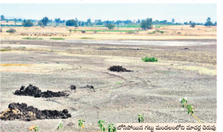
బోసిపోయిన గట్టు మండలంలోని మావల్ల చెరువు

కున్నాయి. జూరాల ప్రాజెక్టులో మిషన్ భగీరథకు సరిపడా నీళ్లు ఉండగా నెట్టింపాడ్ ప్రాజెక్టు కింద కేపలం ఐదువేల ఎకరాలకు మాత్రమే నీరు అందించే అవకాశం ఉందని అధికారులు ప్రతిపాదించారు. గత ప్రభుత్వం రైతుల సంక్షేమానికి వినియోగ పథకాలు, సాగునీటిని అందించేందుకు చేపట్టిన ప్రాజెక్టులు, రిజర్వాయర్ల నుంచి చెరువులకు నీటి విడుదలతో గతంలో సాగు పెరిగింది. తెలంగాణ తొలి ముఖ్యమంత్రి కేసీఆర్ రాష్ట్రంలో వ్యవసాయాన్ని పండుగలా చేసుకునేందుకు అన్ని సదుపాయాలు కల్పించడంతో రైతులు వ్యవసాయంపై మొగ్గు చూపారు. కానీ రాష్ట్రంలో కాంగ్రెస్ అధికారంలోకి వచ్చాక రైతులను గాలికొదిలేయడంతో వారి పరిస్థితి అగమ్యగోచరంగా మారింది. గతంలో యాసంగి మొదలు కాగానే ఖాతాల్లో రైతులండు జమ అయ్యింది. ప్రస్తుతం ఆ పరిస్థితి లేకపోవడంతో యాసంగి సాగుకు అన్నదాత మొగ్గు చూపడం లేదు.