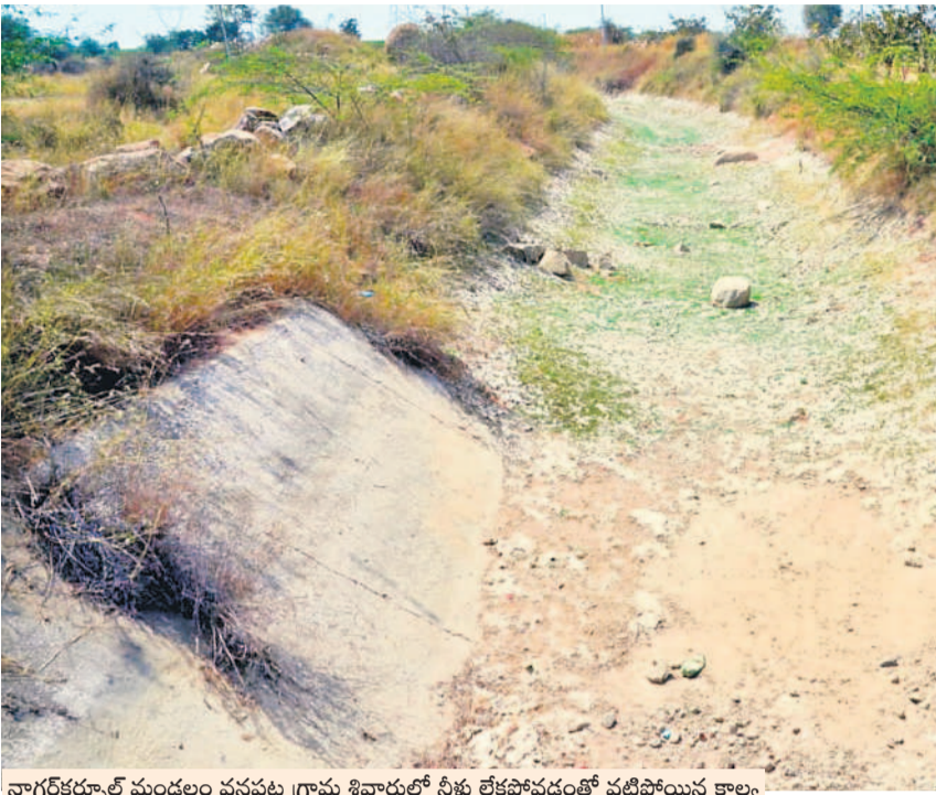
నాగర్ కర్నూల్ మండలం పనపట్ల గ్రామ శివారులో నీళ్లు లేకపోవడంతో వట్టిపోయిన కాల్వ