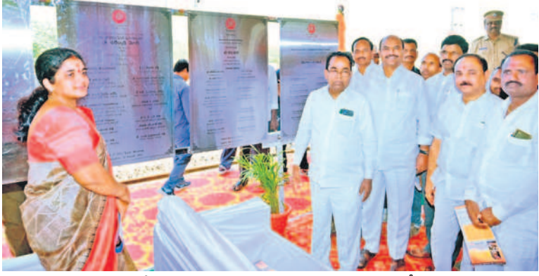
గద్దాల రైల్వేస్టేషన్ పునరాభివృద్ధి పనులను ప్రారంభిస్తున్న ఎంపీ, ఎమ్మెల్యే