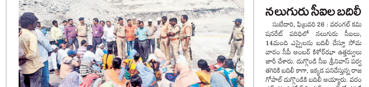
ధర్మా చేస్తున్న నిర్వాసితులతో మాట్లాడుతున్న జె.ఎస్.సీ.పీ. సీ.పీ.సీ.

లేకుంటే బడ్జెట్ సమావేశం బహిష్కరిస్తాం మేయర్ కు కార్పొరేటర్ల అభిమతి వరంగల్, ఫిబ్రవరి 26 : డివిజన్లో పేరుకుపోతున్న సమస్యలు.. వెండిగిల్లో పండుకొట్టి అభివృద్ధి పనులు.. వెరసి ప్రజల్లో తిరుగలేక పోతున్న పనులు, వెంటనే అత్యవసర కౌన్సిల్ సమావేశం ఏర్పాటు చేయాలని ఎన్ని పార్టీల కార్పొరేటర్లు డిమాండ్ చేశారు. సోమవారం కార్పొరేటర్ల సమావేశం 45 మంది సభ్యులు సమావేశం నిర్వహించారు. మేయర్ కార్పొరేటర్లను పట్టించుకోవడం లేదని