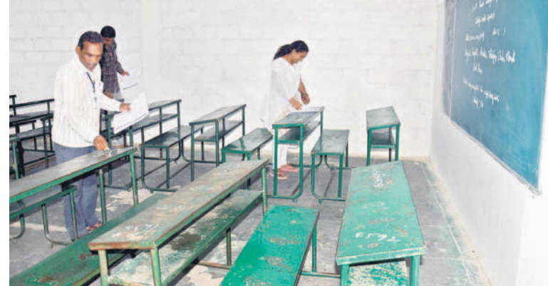
నిజామాబాద్ లోని ఓ పబ్లిక్ కాలేజీలో హాల్ టెలికెట్ నంబర్ వేస్తున్న సిబ్బంది