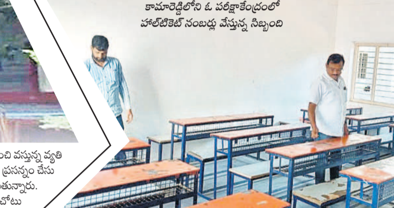
కామారెడ్డిలోని ఓ పబ్లిక్ కాలేజీలో హాల్ టెలికెట్ నంబర్ వేస్తున్న సిబ్బంది