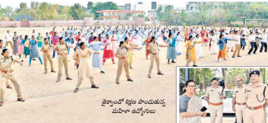
మహిళలకు ఆత్మరక్షణ తప్పనిసరి

కలెక్టర్ జితేష్ ఏ పాటిల్ కామారెడ్డి, ఫిబ్రవరి 27: రాబోయే పాఠ్య మెంటల్ ఎన్నికల సందర్భంగా డిటాబేస్ రూపొందించేందుకు ఉపాధ్యాయులు ఎపిక్ నంబర్లను అందించాలని కామారెడ్డి కలెక్టర్ జితేష్ ఏ పాటిల్ కోరారు. డిజిటల్, ఎంజేయోలు, కాంప్యూటర్ హెడ్ మాస్టర్లతో మంగళవారం నిర్వహించిన జామీ మీటింగ్లో ఆయన మాట్లాడారు. ఓటరు ఓట్ ఎపిక్ నంబర్ ఇవ్వడంతో పోస్టల్ బాడ్జిట్ పేపర్ ముద్రణకు విలువంటున్నారు. పోస్టల్లో అనుమతి లేకుండా ఉపాధ్యాయులు గ్రౌండ్ జర పుతున్నట్లు తమ దృష్టికి వచ్చిందని, ఇక నుంచి పోస్టల్లో తనిఖీ చేసేందుకు సీనియర్ అధికారులను నియమిస్తున్నట్లు తెలిపారు. ముందస్తు అనుమతి తీసుకోకే నెల పులు తీసుకోవాలని, అధికారుల తనిఖీలో ఉపాధ్యాయులు గ్రౌండ్ జరపే గుర్తిస్తే చర్యలు తీసుకుంటామని హెచ్చరించారు. పదో తరగతి పరీక్షలను సజావుగా జరిగేలా చూడాలన్నారు.