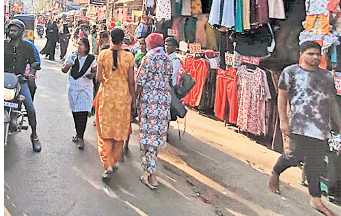
పుట్ పాత్ లు ఆక్రమణలు కావడంతో రోడ్డుపైనే నడక సాగిస్తున్న పాదచారులు

బేగంపేట్, ఫిబ్రవరి 28 : వ్యాపార, వాణిజ్య కేంద్రాలకు నిలయం లష్కర్, అలాంటి ప్రాంతంలో పాదచారులు, వాహనదారులు నడవలేని పరిస్థితులు నెలకొన్నాయి. దుకాణాల ఎదుట ఫుట్ పాత్ లను కనిపించకుండా పోయాయి. ప్రధానంగా లష్కర్ రోడ్డు, పుట్ పాత్ లను బదలబాబులు, దుకాణాల యజమానులే ఆక్రమిస్తున్నారు. చిన్న గల్లీ రోడ్డును కూడా వదలకుండా ఆక్రమారులు వాటిని ఆక్రమించి వ్యాపారాలు సాగిస్తున్నారు. బేగంపేట్ సర్కిల్ పరిధిలోని మోండా మార్కెట్, రాంగోపాల్ పేట, బేగంపేట ప్రాంతాల్లో