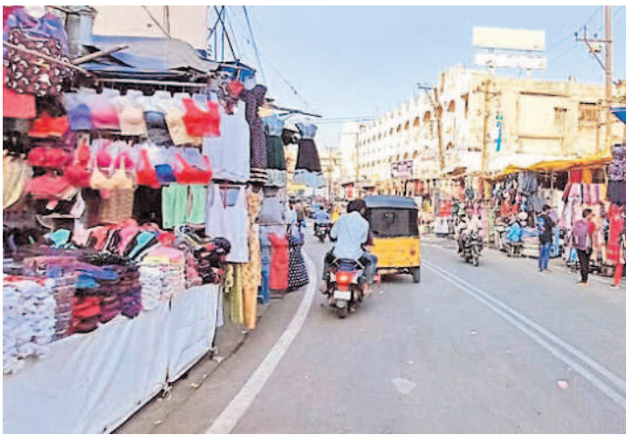
లష్కర్ కింగ్స్ దర్వారా రోడ్డుకు ఇరువైపులా ఫుట్ పాత్ లపై వెలిసిన దుకాణాలు

పట్టించుకోని ట్రాఫిక్, టౌన్ ప్లానింగ్ అధికారులు పాదచారులు, వాహనదారులకు ఇబ్బందులు