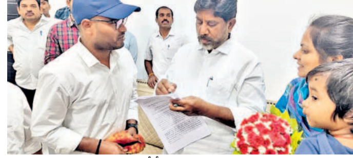
డిప్యూటీ సీఎం భట్టి విక్రమారావు వినతిపత్రం అందజేస్తున్న స్పోర్ట్స్ కోటా పంచాయతీ కార్యదర్శులు

పాబాద్, ఫిబ్రవరి 28: స్పోర్ట్స్ కోటాలో జూనియర్ పంచాయతీ కార్యదర్శుల పునర్నియామకం చేపట్టాలని స్పోర్ట్స్ కోటా పంచాయతీ కార్యదర్శులు కోరారు. బుధవారం సగరంలో ఉప ముఖ్యమంత్రి భట్టి విక్రమారావు పాటు పలువురు మంత్రులను కలిసి వినతిపత్రాలు అందజేశారు. ఈ సందర్భంగా వారు మాట్లాడుతూ.. 2019 నుంచి గ్రామాల్లో పంచాయతీ కార్యదర్శులుగా విధులు నిర్వహిస్తున్న సంబంధించి రెండేళ్ల క్రితం స్పోర్ట్స్ కోటా కింద ఎంపిక కాని అభ్యర్థులు కోర్టులో కేసు వేశారన్నారు. కోర్టు కేసులో పంచాయతీ రాజ్ శాఖ