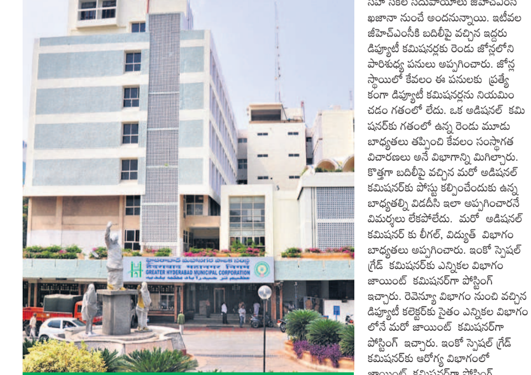
భారమని తెలిసిన ఎందుకీ మోసం?

జీహెచ్ఎస్ఐలో ప్రస్తుతం ప్రతి నెలా వేతనాలు, పెన్షన్లు రూ. 120-130 కోట్లు చెల్లింపాల్సి వస్తోంది. అయితే సంస్థలో అవసరాల మేరకు మాత్రమే డిప్యూటీ షఫ్టు ప్రాక్టీసాచి. కానీ అలా జరగడం లేదు. హైదరాబాద్ లో ఉండాలనుకునే ఉద్యోగులలా హైదరాబాద్ లో ఉండరు. కమిషనర్లను సంప్రదించి మరికొందరు వస్తున్నారు. కానీ ఇటీవల కాలంలో డిప్యూటీ షఫ్టు మెట్ల పాల్చి పరిచారు. పోలీస్ వచ్చిన వారితో ఆశించిన స్థాయి ఫలాలు శూన్యమనే చెప్పాలి. ఎందుకంటే జీహెచ్ఎస్ఐకి రావాల్సిన ఆదాయం రావడం లేదు. చెక్ సమస్యలు తగ్గడం లేవు. విద్యుత్ విభాగం సగరంలో బిక్కులు నివారించలేకపోతోంది. ప్రకటనల విభాగం అక్రమాలకు అడ్డాగా మారింది. రెవెన్యూ విభాగం ట్యాక్స్ లోని లోపాలు అరికట్టలేకపోతోంది. అనేక అంశ.. ఏ విభాగంలో మానూ నిర్లక్ష్యం రాజ్యమేలుతోంది. ఇటీవల అభ్యయం హస్తం దరఖాస్తులు గాల్లో కొట్టుకు పోవడం అందుకు ఒక నిదర్శనం. కార్యోధితులు ఫిర్యాదు చేసినా అధికారులు స్పందించరు.