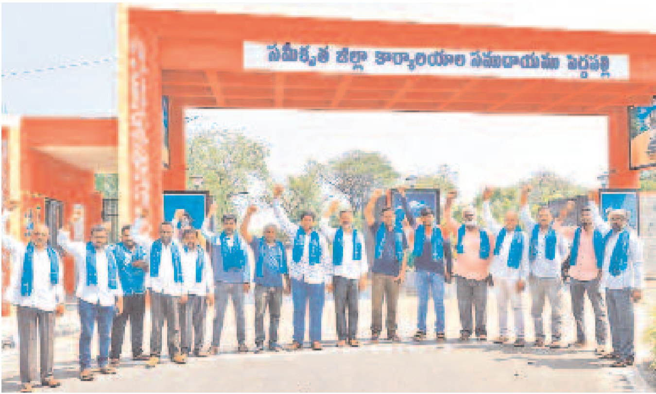
కాశ్మీరం నీటిని వదలాలని, ఎందుకన్న తమ పంటలను కాపాడాలని డిమాండ్ చేస్తూ గురువారం పెద్దపల్లి కలెక్టరేట్ వద్ద రైతుల ఆందోళన

PUBLISHED FROM KARIMNAGAR • HYDERABAD • WARANGAL • KHAMMAM • NALGONDA • MAHABUBNAGAR • NIZAMABAD www.ntnews.com ntdailyonline