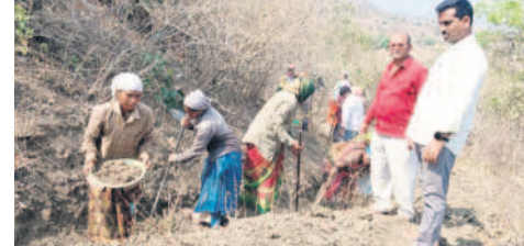
ఉషాపాదిహామీ పనులను పరిశీలించి ఏపీవో శాకిర్ ఉస్మాన్ నియా

తిర్వాణి, ఫిబ్రవరి 29: ఉషాపాది హామీ పనుల కల్పించాలని ఏపీవో శాకిర్ ఉస్మాన్ అన్నారు. గురువారం తిర్వాణిలో ఉషాపాది హామీ పనుల కల్పించాలని ఏపీవో శాకిర్ ఉస్మాన్ అన్నారు.