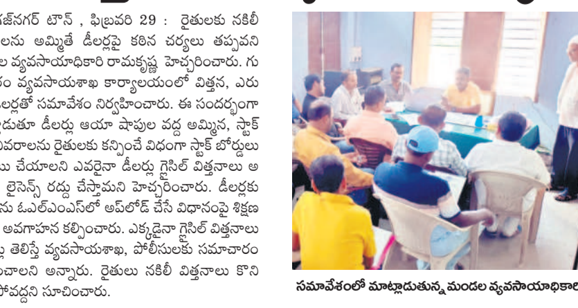
సమావేశంలో మాట్లాడుతున్న మండల వ్యవసాయాధికారి

24 మంది గైర్వాజులను తెలిపారు. సిట్టింగ్ స్కాన్, స్కాన్, డి.ఎ. పర్యవేక్షించినట్లు తెలిపారు. జిల్లా సీఎం, ఫిబ్రవరి 29: మండల కేంద్రంలోని ప్రభుత్వ కళాశాలలో గురువారం ఇంటర్ పరీక్షలు ప్రారంభం జరిగింది.