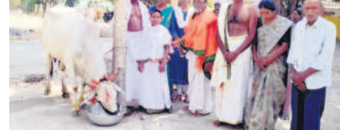
కొటాల: గోమాతను శివాలయంలోని గోశాలకు దానం చేస్తున్న భక్తులు

కొటాల, ఫిబ్రవరి 29: కొటాల శివాలయంలోని గోశాలకు గురువారం గుడ్ బాయ్ రిసెప్షన్ సందర్భంగా దంపతులు అవు లేగదూడ దానం చేశారు.