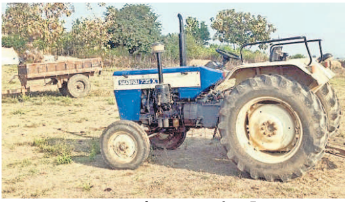
శిథిలావస్థలో గ్రామపంచాయతీ ట్రాక్టర్