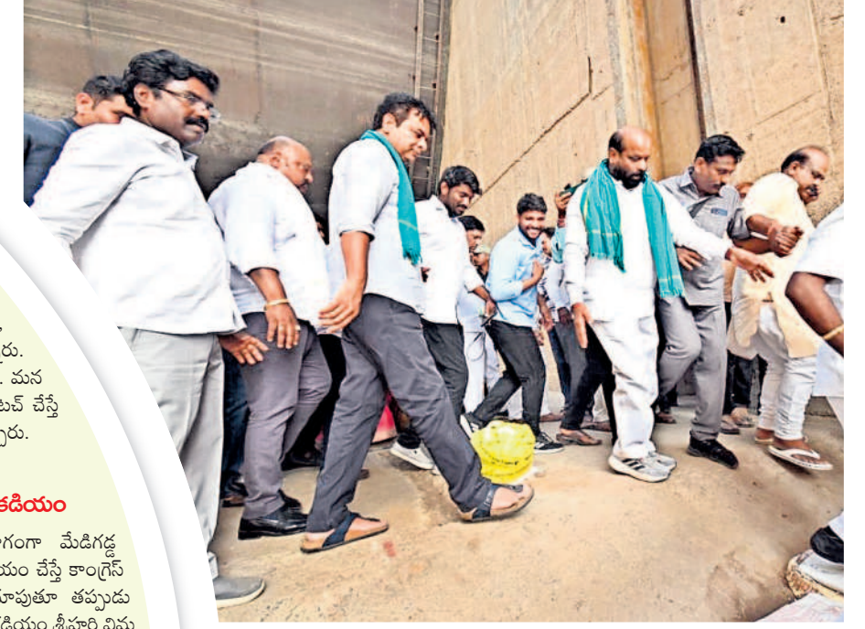
బీఆర్ఎస్ శ్రేణులతో కలిసి మేడిగడ్డ బరాజ్ ను పరిశీలిస్తున్న కేటీఆర్

లింగాలమునపురం, మార్చి 1 : బీఆర్ఎస్ శ్రేణులలో ఓ ఓపిక పట్టండి.. ఆరు నెలల్లోనే సీఎం సీటు కోసం కాంగ్రెస్ లో లొల్లి పెట్టుకుంటారు.. ఇప్పటికే చాలా మంది సీనియర్లకు కన్ను బుసుగుంటున్నారు.. ప్రజలకి కిచ్చిన హామీలు అమలు చేయలేక.. సొంత కుంభకోణంతో ఆగం చేస్తున్నారని మాజీ మంత్రి ఎర్రబెల్లి దయాకర్ రావు అన్నారు. బీఆర్ఎస్ వర్కింగ్ సెలెక్షన్ కేటీఆర్ నేతృత్వంలో శుభవారం చేపట్టిన మేడిగడ్డ యాత్ర హైదరాబాద్-వరంగల్ హైవేపై నెల్లూరు జైపాస్ వద్దకు చేరుకోగా పార్టీ శ్రేణులు ఘన స్వాగతం చలిచాయి. ఈ సందర్భంగా ఎర్రబెల్లి దయాకర్ రావు మాట్లాడుతూ ప్రాజెక్టులను కొల్లగొట్టిన సంస్కృతి కాంగ్రెస్ నినాదాలు. ఎన్ఆర్ఎస్ కె కాల్య తవ్వకాలను బాధి ప్రాజెక్టు నిర్మాణ సమయంలో తాను తెలంగాణ ప్రయోజనాల కోసం ఉద్యమించానన్నారు. ఎన్నికలకు ముందు ప్రజలకి బిచ్చం అరుగులు తీసుకుంటున్నారని అన్నారు. కాంగ్రెస్ పార్టీ నేతలు కాశీశ్వరంపై కట్టు కథలు ప్రచారం చేస్తున్నారని ఆయన విమర్శించారు. బీఆర్ఎస్ కార్యకర్తలు ఎక్కడా నిలిచి కాశీశ్వరం ప్రాజెక్టుపై వాస్తవాలను