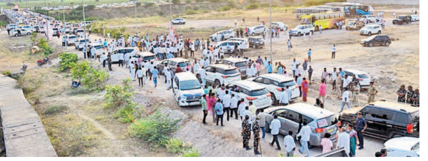
మేడిగడ్డ బరాజ్ వద్ద బీఆర్ఎస్ నాయకులు