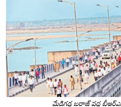
మేడిగడ్డ బరాజ్ వద్ద బీఆర్ఎస్ శ్రేణులు

చలో మేడిగడ్డ కార్యక్రమం పోలీసుల తీరుతో కొద్దిసేపు ఉద్రిక్తంగా మారింది. కేటీఆర్ బృందం వెళ్తున్న నేపథ్యంలో అక్కడికి చేరుకున్న బీఆర్ఎస్ కార్యకర్తలను పోలీసులు ట్రిడ్డి మెయిన్ గేట్ మూసివేసి అనుమతిపకపోవడంతో కార్యకర్తలు ఆందోళన చేశారు. మెయిన్ గేట్ తీసుకొని ట్రిడ్డిపైకి వెళ్లడం ప్రయత్నించిన బీఆర్ఎస్ కార్యకర్తలు, పోలీసులకు మధ్య తోపులాట జరిగింది. ఈ క్రమంలో కార్యకర్తలకు స్వల్ప గాయాలయ్యాయి. తొక్కిసలాటలో ఓ మహిళా కార్యకర్త కిందపడింది.