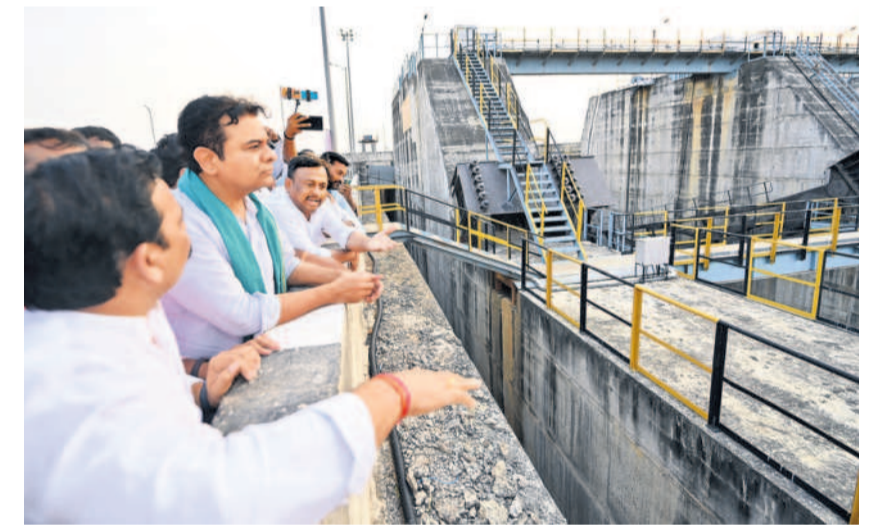
అన్నారం ప్రాజెక్టును పరిశీలిస్తున్న కేటీఆర్