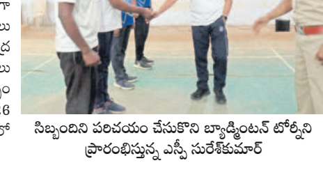
సిబ్బందిని పరిచయం చేసుకొని బ్యాడ్మింట్ టీనాగల్