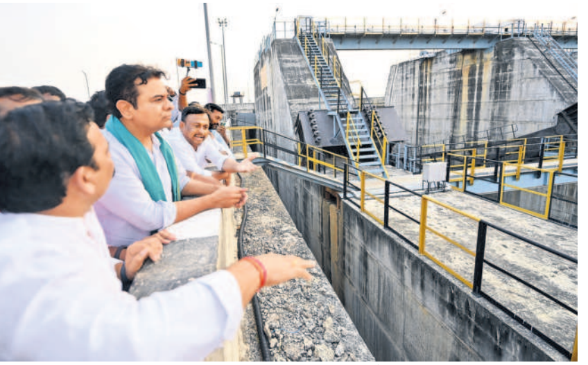
అన్నారం ప్రాజెక్టును పరిశీలిస్తున్న కేటీఆర్