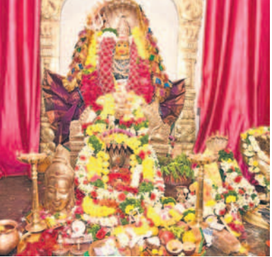
పోలేపల్లిలోని ఎల్లమ్మ తల్లి మూలాలలో