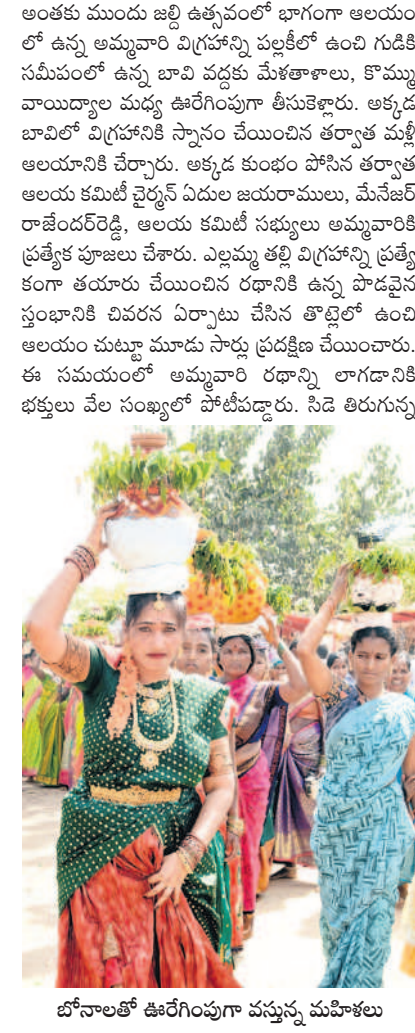
బోనాలతో ఊరేగింపుగా వస్తున్న మహిళలు

బొంబాయి/కొస్గి, మార్చి 1 : పోలేపల్లి ఎల్లమ్మ సిడె ఉత్సవం కనులపండువగా సాగింది. తెలంగాణలో పాటు పక్క రాష్ట్రాల నుంచి భక్తులు వేలాదిగా తరలి రాగా.. వారి సమక్షంలో వేడుక ఆధ్వర్యంలో ఆనంద భరితంగా జరిగింది. విశాఖాబాద్ జిల్లా దుర్గాల మండలంలోని పోలేపల్లి ఎల్లమ్మ జాతర వైభవంగా జరుగుతున్నది. ఉత్సవాల్లో ప్రధాన ముఖ్యమైన సిడె కార్యక్రమం శుక్రవారం సాయంత్రం నయనానందకంగా నిర్వహించారు. ఎల్లమ్మ తల్లి.. మమ్మల్ని చల్లగా చూడమ్మా.. అన్న నామస్మరణ మార్గంగా.. భక్తుల కేరింతలు, జయజయ ధ్వనులు ఓవైపు.. మేళాకాలు, డప్పు చప్పుళ్లు మరో వైపు జాతరకే హైలైట్.. మహిళలు పూసకాలతో ఊగిపోయారు. సాయంత్రం సిడె వేడుక 15 నిమిషాలపాటు శోభాయమానంగా జరిగింది.