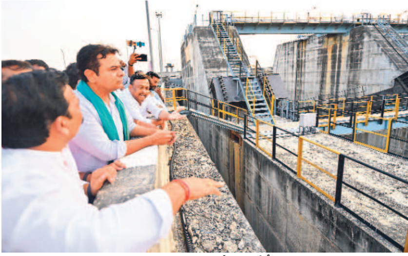
అన్నారం ప్రాజెక్టును పరిశీలిస్తున్న కేటీఆర్