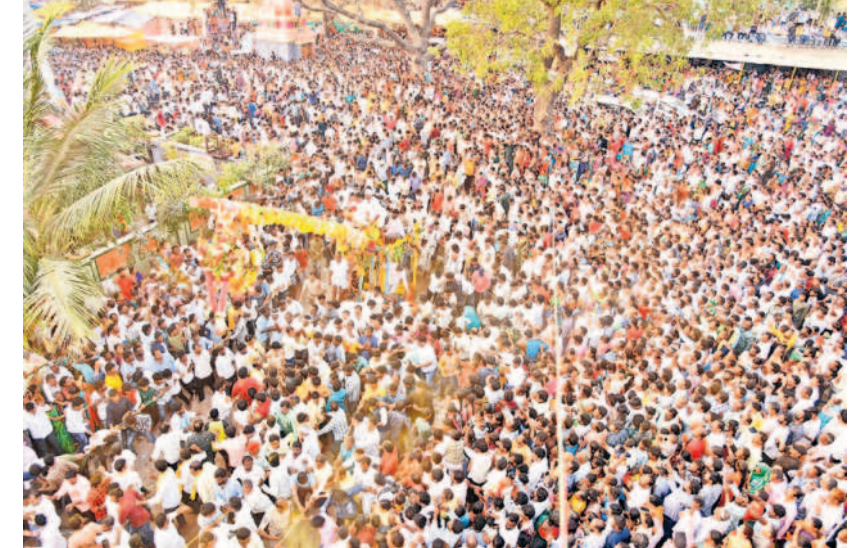
పోలేపల్లి ఎల్లమ్మ ఉత్సవాల్లో భాగంగా సిడె నిర్వహిస్తున్న భక్తులు

సమయంలో పలువురు భక్తులు పూసకాలు నిండారు. భక్తులు వేపాకు, పసుపు, గవ్వలు కలిపిన గవ్వల బండారాను అమ్మవారిపైకి విసరగా.. గవ్వలను ఏరుకోవడానికి భక్తులు పోటీ పడ్డారు. పోతరాజుల విన్యాసాలు జాతరలో ఆకర్షణగా నిలిచాయి.