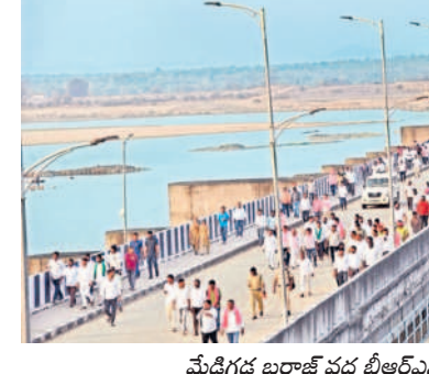
మేడిగడ్డ బరాజ్ వద్ద బీఆర్ఎస్ శ్రేణులు

చలో మేడిగడ్డ కార్యక్రమం పోలీసుల తీరుతో కొద్దిసేపు ఉద్రిక్తంగా మారింది. కేటీఆర్ బృందం వెళ్తున్న నేపథ్యంలో అక్కడికి చేరుకున్న బీఆర్ఎస్ కార్యకర్తలను పోలీసులు ట్రిడ్డి మెయిన్ గేట్ మూసివేసి అనుమతించకపోవడంతో కార్యకర్తలు ఆందోళన చేశారు. మెయిన్ గేట్ తీసుకొని ట్రిడ్డిపైకి వెళ్లేందుకు ప్రయత్నించిన బీఆర్ఎస్ కార్యకర్తలు, పోలీసులకు మధ్య తోపులాట జరిగింది. ఈ క్రమంలో కార్యకర్తలకు స్వల్ప గాయాలు య్యాయి. తొక్కిసలాటలో ఓ మహిళా కార్యకర్త కిందపడింది.