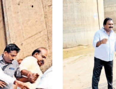
మేడిగడ్డ బరాజ్ వద్ద మాజీ ఎమ్మెల్యేలు అరూరి, దాస్యం, పెద్ది తదితరులు