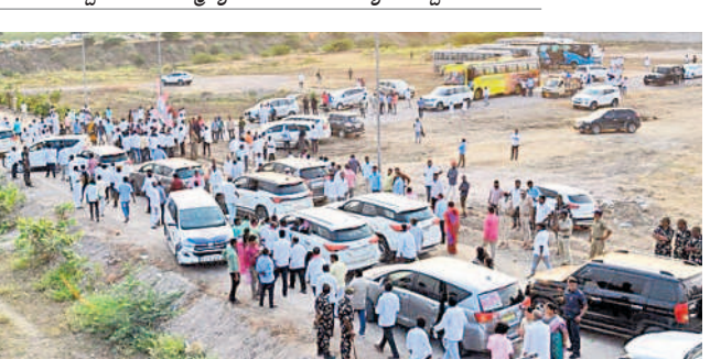
మేడిగడ్డ బరాజ్ వద్ద బీఆర్ఎస్ నాయకులు