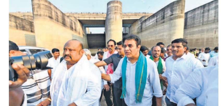
మేడిగడ్డ వద్ద కేటీఆర్, ఎమ్మెల్యేలు మాంగం గివీనాథ్, గంగుల కమలాకర్, తదితరులు