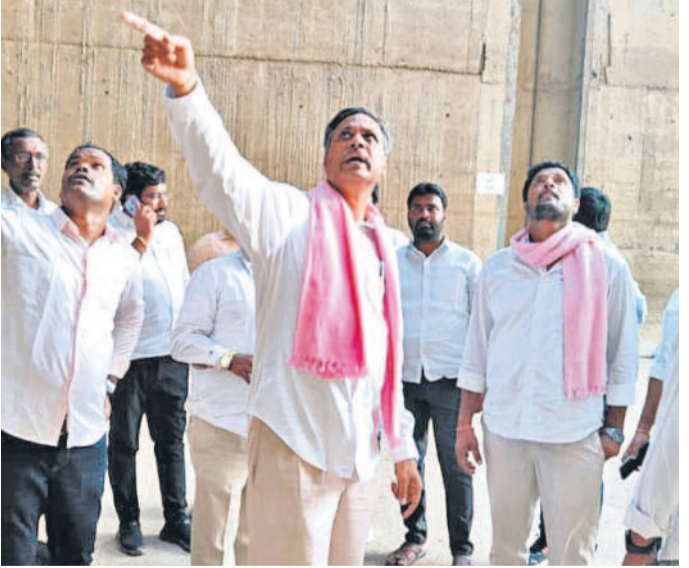
మేడిగడ్డ ప్రాజెక్టును పరిశీలిస్తున్న ఎమ్మెల్యే వల్లారాజేశ్వర్ రెడ్డి, తదితరులు