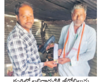
కంగ్రిల్ లిబ్రెరరీలో జీరో బిల్లులను అందజేస్తున్న విద్యుత్ సబ్సిడీ

కంగ్రిల్, మార్చి 1 : రేషన్ కార్డు ఉండి జీరో బిల్లు రాకపోవే వారు వెంటనే స్థానిక మండల పరిషత్ కార్యాలయంలో రేషన్ కార్డు, ఆధార్ కార్డు, కరెంట్ బిల్లులు అందజేయాలని కంగ్రిల్ జూనియర్ టైమ్స్ సరోజిగాడ్ అన్నారు.