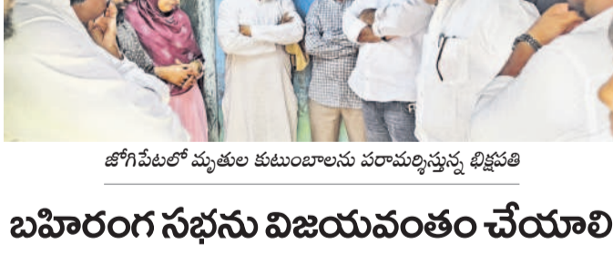
జోగిపేటలో మృతుల కుటుంబాలను పరామర్శిస్తున్న భిక్షపతి

మృతి చెందారు. శుక్రవారం స్థానిక నాయకులతో కలిసి మృతుల కుటుంబాలను పరామర్శించారు.