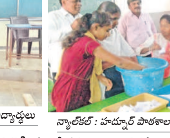
స్వారాజ్యం : హద్దూర్ పాఠశాలలో మాక్ పోలింగ్ ఓట్ల లెక్కింపును విద్యార్థులు

అన్ని కల విధానంపై విద్యార్థులకు అవగాహన కలిగించడానికి శుక్రవారం సంగారెడ్డి జిల్లాలోని వివిధ పాఠశాలల్లో ఉపాధ్యాయులు మాక్ పోలింగ్ను నిర్వహించారు.