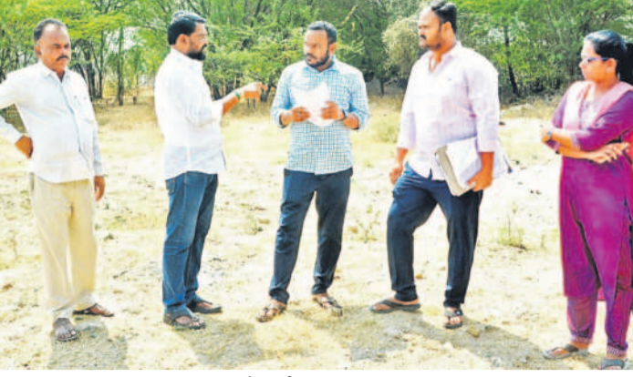
సంగారెడ్డి : ఇన్స్పాయిల్ ఖానాపేటలో ధరణి దరఖాస్తులపై విచారణ చేస్తున్న ఆర్ఎం