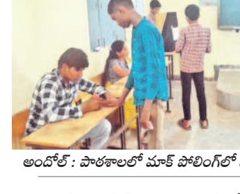
అందోల్ : పాఠశాలలో మాక్ పోలింగ్లో విద్యార్థులు