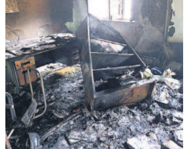
ఆడిట్ కార్యాలయంలో కాలిపోయిన ఫర్నిచర్, పైల్ట్