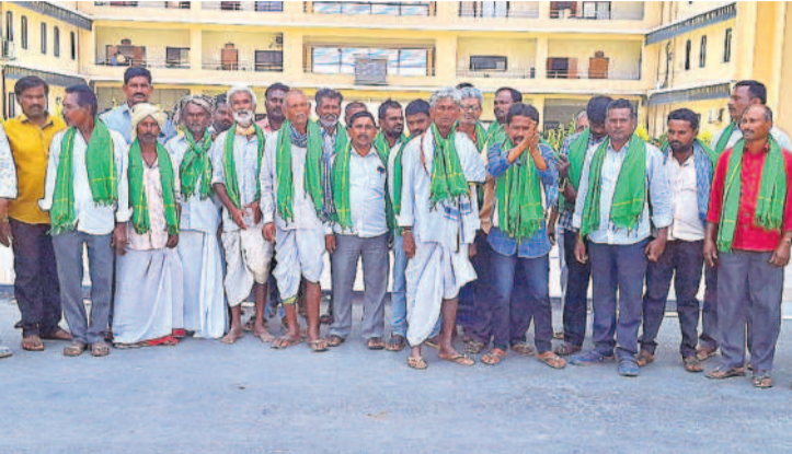
సూర్యాపేట కలెక్టరేట్ ఎదుట నిరసన తెలుపుతున్న రైతులు