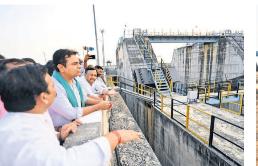
అన్నారం ప్రాజెక్టును పరిశీలిస్తున్న కేటీఆర్

చేయనున్నట్లు ప్రకటించారు. దాంతో సాగర్ నీటి మట్టం మరింత తగ్గగా తగ్గనున్నది. ఏఎమ్సార్పీ నుంచి నల్లగొండ జిల్లాకు, జలం నగరానికి నిత్యం 700 పైగా క్యూసెక్కుల నీటిని విడుదల చేయాల్సి ఉంది. దాంతో 510 అడుగుల మేరకు మాత్రమే ఏఎమ్సార్పీ మోటార్లు నడిపే అవకాశం ఉంది. అంత మించి నీటి మట్టం తగ్గితే పుట్టంగిడి జిరో పాయింట్ వద్ద అత్యవసర మోటార్లు ఏర్పాటు చేసి అప్రోచ్ కెనాల్ కు ఎక్స్పోయర్ట్ ఉంటుంది. గతంలో అత్యవసర మోటార్లకు కూడా నీరు అందని పరిస్థితుల్లో కేవల ప్రభుత్వం కృషి నడిపే కాల్య (డ్రైఫ్టింగ్) తప్పకనే చేపట్టడం జరిగింది. దాంతో యానంగి నీజినే సాగర్, ఏఎమ్సార్పీ ఆయకట్టులో ప్రభుత్వం క్రాఫ్ హాల్డెడ్ ప్రకటిం చింది. కేవలం తాగునీటి అవసరాలకు మాత్రమే నీటిని వినియోగిస్తున్నారు. ప్రస్తుతం సాగర్ జలా శయం నీటిమట్టం 516.20 అడుగులకు చేరుకోగా 142 టీఎంసీల మేర నీటి నిల్వ ఉంది. శుక్రవారం ఆంధ్రా తాగునీటి అవసరాల కోసం ముంబాయి కృష్ణా రివర్ బోర్డు ఆడిటల్ మేరకు ఎన్ఎస్పీ ఆధారితంగా కుడి కాల్వలకు నీటిని విడుదల చేశారు. తొమ్మిది రోజుల పాటు మరో 3 టీఎంసీల నీటిని విడుదల