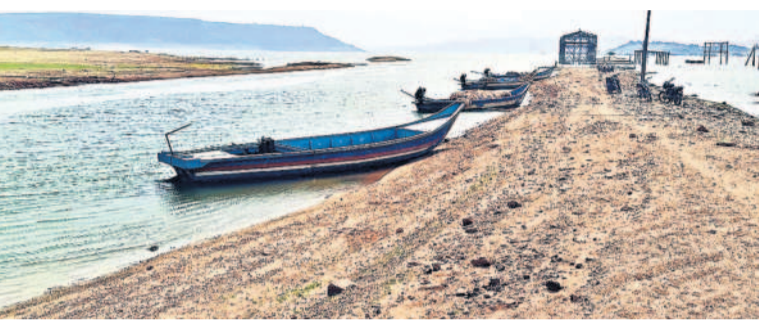
డెడ్ స్టోరేజ్ పరిస్థితుల్లో పుట్టంగిడి నుంచి నీటిని తరలించే అప్రోచ్ కెనాల్

ప్రమాదంపై అనుమానాలు అగ్ని ప్రమాదం ఘటనపై కొందరు పలు రకాల అనుమానాలు వ్యక్తం చేస్తున్నారు. షార్ట్ సర్క్యూట్ జరిగిందా లేక ఏదైనా అక్రమాలకు పాల్పడిన వారు ఉద్దేశ పూర్వకంగా చేశారా అనే గుసగుసలు వినిపిస్తున్నాయి.