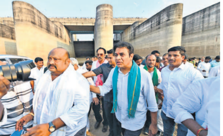
మేడిగడ్డ వద్ద కేటీఆర్, ఎమ్మెల్యేలు మాగంటి గోపీనాథ్, గంగుల కమలాకర్, తదితరులు