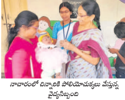
నాచారంలో బిన్నాలికి పోలియో చుక్కలు వేస్తున్న వైద్య సిబ్బంది