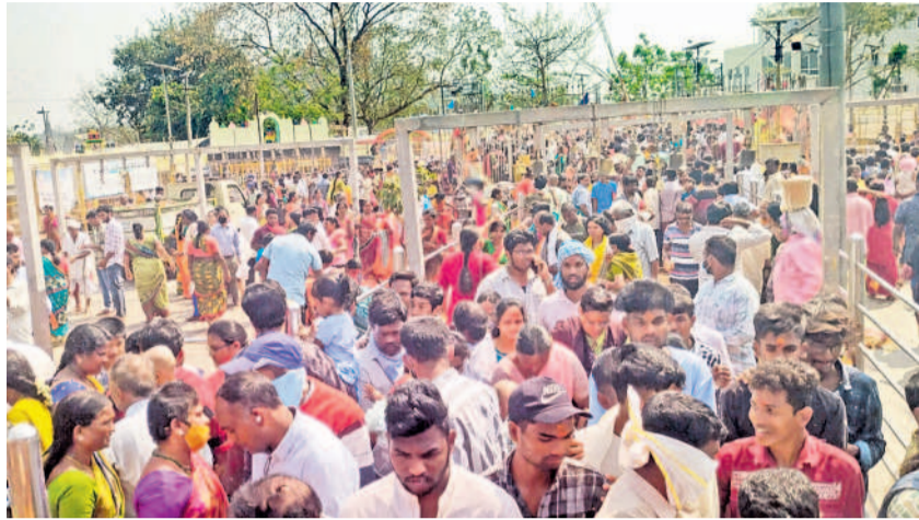
వినదేవితల సన్నిధిలో అమ్మవార్ల దర్శనానికి వస్తున్న భక్తులు

బీఆర్ఎస్ అధినేత కేసీఆర్ హాజరు ఆయా నియోజకవర్గాల నేతల నుంచి అభిప్రాయాలు సేకరించనున్నారు. ఇందుకోసం ఇప్పటికే కొందరు నాయకులు మహబూబాబాద్ చేరుకోగా, మరి కొంతమంది సోమవారం వెళ్తున్నారు. ఎమ్మెల్యేలు, ఎమ్మెల్యేలు, ఎంపీతోపాటు మాజీ ఎమ్మెల్యేలు, మాజీ ఎమ్మెల్యేలు, ఇతర ముఖ్య నాయకులు ఈ సమావేశంలో పాల్గొనున్నారు. ఈ సమావేశంలోనే బీఆర్ఎస్ పార్లమెంట్ అభ్యర్థి ఎవరనేది వెల్లడి కానుంది.