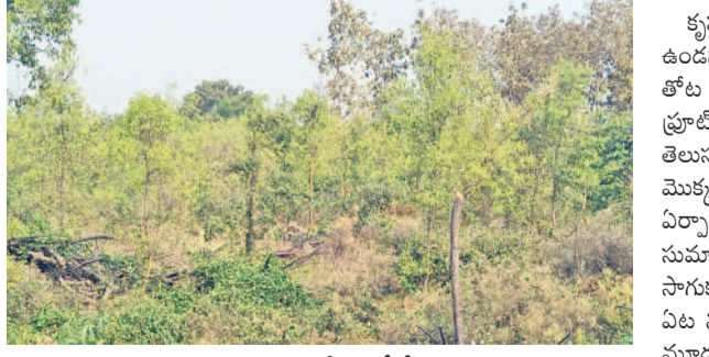
కృష్ణమూర్తి వ్యవసాయ క్షేత్రంలో శ్రీగంధం చెట్టు

డ్రాగన్ ఫ్రూట్, శ్రీగంధం, మహాగని, తైవాన్ జామ, మల్లర్ తోటల సాగుతో సత్పితాలు నేరుగా వినియోగదారులకు విక్రయాల.. ఆదర్శంగా నిలుస్తున్న రేపాకపల్లి రైతు