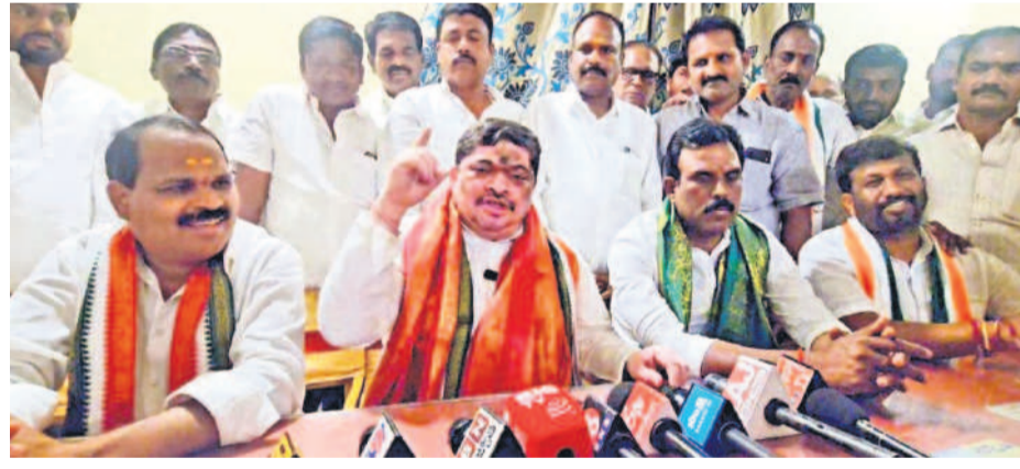
రాయలకోటలోని ఓ ఓటర్ లో విలేజ్ లలో మాట్లాడుతున్న పాన్సం ప్రభాకర్