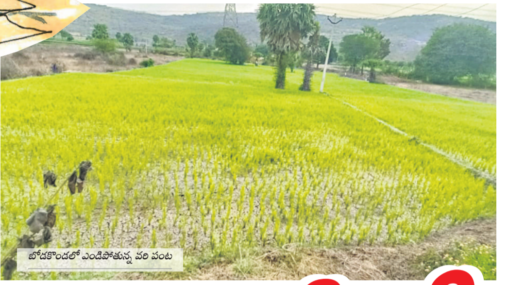
బోడకొండలో ఎండిపోతున్న వరి పంట

నెర్రలు బాలిన పంటను చూసి రైతుల కండ్లల్లో నీళ్లు తిరుగుతున్నాయి... బీఆర్ఎస్ ప్రభుత్వ హయాంలో తెంపులేకుండా కరెంటు... పుష్కలంగా సాగునీరు ఉండడంతో ఎప్పుడూ సాఫీగా సాగింది... కల్లబొద్ది పంటలు చెప్పి కార్పెన్ అధికారంలోకి వచ్చింది... కరువును తెచ్చింది... జలదార వెనుకపట్టు పట్టింది... బోరుబావుల్లో ఊట తగ్గింది... కరెంటు అయినా పొద్దంతా వస్తే వరుస తడులతోనైనా పంటకు నీరు పెడుతామంటే కరెంటు కోతలతో నాలుగు ఎకరాలు పారే బోరుబావి అర ఎకరం కూడా పారడం లేదు... ఎంత కష్టమొచ్చే దెవుడా... అంటూ అన్నదాతలు ఆందోళన చెందుతున్నారు.