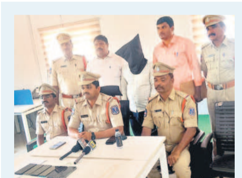
విలేజ్ లలో తూట్లాడుతున్న సీబీ రెవెన్యూ అధికారులు