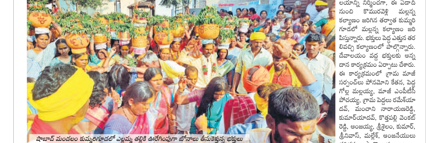
షాబాద్ మండలం కుమ్మరిగూడలో ఎల్లయ్య తల్లికి ఊరేగింపుగా బోనాలు తీసుకెళ్తున్న భక్తులు