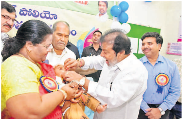
అంబోల్: జోగిపేటలో పోలియో చుక్కలు వేస్తున్న మంత్రి దామోదర రాజనర్సింహ