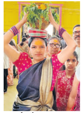
భోసంతో మహిళా భక్తురాలు