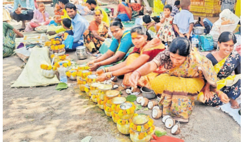
భోసంతయారు చేసిన మొక్కు చెల్లించుకుంటున్న భక్తులు

కొమురవెళ్ల మల్లన్న దర్శనానికి వచ్చిన భక్తులు ఆదివారం వెతుకుతూ మునిపల్లె మార్గం, ఉదయం 5 గంటలకు కరెంటు సరఫరా నిలిచిపోవడంతో కూర్చున్న, గర్భగుడి, గంగరేగు చెయ్యి తదితర ప్రదేశాల్లో చీకటి అలుముకున్నది. దీంతో భక్తులు ఇబ్బందికి గురయ్యారు. 15 నిమిషాల పాటు కరెంట్ సరఫరాకు అంతరాయం ఏర్పడింది. కరెంట్ పోతే అటోమెటిక్గా స్టాప్ అయ్యే ఆధునిక టెక్నాలజీ కలిగిన జనరేటర్, దాని నిర్వహణ కోసం ఆలయ ఉద్యోగి, ఇద్దరు పరిశీలకులు ఉన్నప్పటికీ మల్లన్న భక్తులు చిమ్మ చీకట్లో మగ్గడం తప్పలేదు.