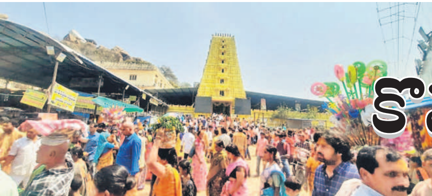
కొమురవెళ్ల అలయం రాజగోపురం వద్ద భక్తుల రద్దీ

వైభవంగా స్యామివారి బ్రహ్మోత్సవాలు ఏడో వారానికి భారీగా తరలివచ్చిన భక్తులు ప్రత్యేక పూజలు చేసిన మొక్కులు తీర్చుకున్న భక్తజనం