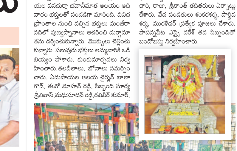
కూర్చున్న భక్తుల నందం, ఇనీట్ల పూజలు అందుకుంటున్న వనదుర్గా భవాని మాత