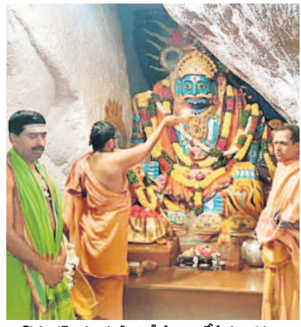
కొమురవెళ్ల మల్లికార్జున స్వామికి పూజలు చేస్తున్న భక్తులు