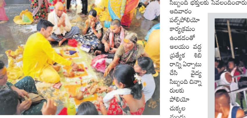
వత్సం వేసి మొక్కులు చెల్లించుకుంటున్న భక్తులు