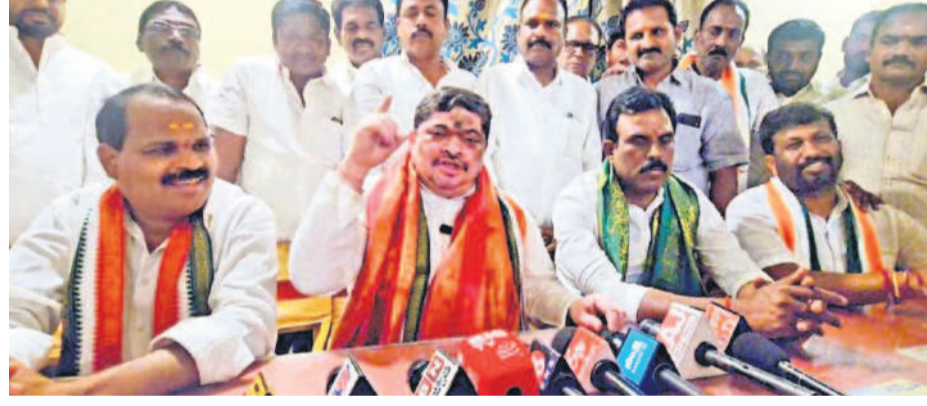
రాయకల్లోని ఓ హోటల్ లో విలేజులలో మాట్లాడుతున్న పానం ప్రభాకర్