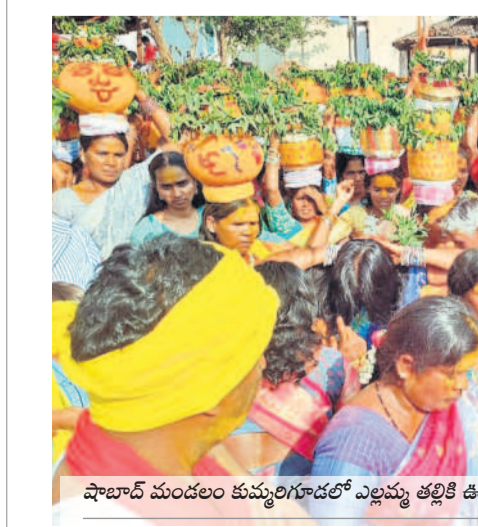
షాబాద్ మండలం కుమ్మరిగూడలో ఎల్లమ్మ తల్లికి ఊరేగింపుగా బోనాలు తీసుకెళ్తున్న భక్తులు