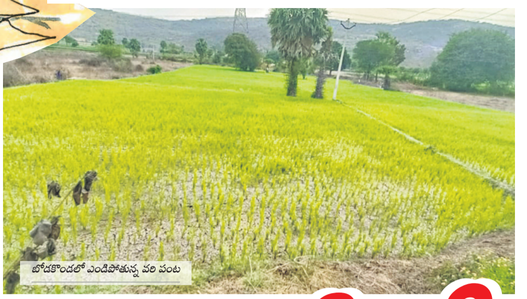
బోడకొండలో ఎండిపోతున్న వరి పంట

నెర్లులు బారిన పంటను చూసి రైతు కండ్లల్లో నీళ్లు తిరుగుతున్నాయి... బీఆర్ఎస్ ప్రభుత్వ హయాంలో తెంపులేకుండా కరెంట్.. పుష్కలంగా సాగునీరు ఉండడంతో ఎప్పుడూ సాఫీగా సాగింది.. కల్లబొద్ది పంటలు చెప్పి కారెన్స్ అధికారంలోకి వచ్చింది.. కరువును తెచ్చింది.. జలధార వెనుకపట్టు పట్టింది.. బోరుబావుల్లో ఊట తగ్గింది.. కరెంటు అయినా పొద్దంతా వస్తే వరుస తడులతోనైనా పంటకు నీరు పెడుతామంటే కరెంట్ కోతలతో నాలుగు ఎకరాలు పారే బోరుబావి అర ఎకరం కూడా పారడం లేదు.. ఎంత కష్టమొచ్చే దెవుడా.. అంటూ అన్నదాతలు అందోళన చెందుతున్నారు.