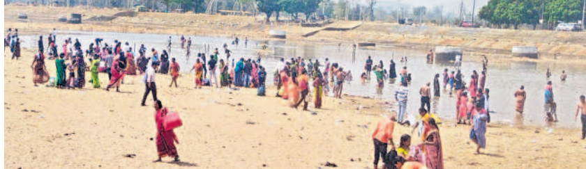
ఇంకొకవైపు మురుగునీటిలో స్నానాలు చేస్తున్న భక్తులు

బారులు తీరిన భక్తులు జాతర ముగిసినా కొనసాగుతున్న మొక్కులు గద్దెల పరిసరాలు భక్తులతో కిక్కిరిసిపోయాయి. అదివారం రెండు లక్షల మంది భక్తులు అమ్మవార్లను దర్శించుకున్నట్లు తెలిపారు. స్నానాలకు నీళ్లు లేక ఇక్కట్లు భక్తులు పుణ్యస్థానాలు చేయడానికి ఇంకొకవైపు గుర్తో నీళ్లు లేకపోవడంతో ఇబ్బందులు పడ్డారు. జాతర ముగియడంతో వాగులో భక్తుల కోసం ఏర్పాటు చేసిన బ్యాటరీ ఆఫ్ ట్యాంకులు తొలగించారు. నీళ్లులేకపోవడంతో అధికారులు తీరుపై ఆగ్రహం వ్యక్తం చేశారు. వాగులో నీలివి ఉన్న మురుగు నీటిలోనే స్నానం చేసి మొక్కులు చెల్లించుకుంటున్నారు. ఇంటి వంతెనల వద్ద తాత్కాలిక బ్యాటరీ ఆఫ్ నీరు దేవదానయాశాఖ అధికారులు ఏర్పాటు చేసేవారు. ఈసారి అధికారులు భక్తులకు సౌకర్యాలను కల్పించడంలో నిర్లక్ష్యంగా వ్యవహరించినట్లు ఆరోపణలు వస్తున్నాయి.