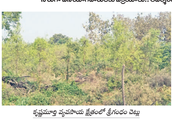
కృష్ణమూర్తి వ్యవసాయ క్షేత్రంలో శ్రీగంధం చెట్టు

డ్రాగన్ ప్రూట్, శ్రీగంధం, మహాగని, తైవాన్ జామ, మల్లరీ తోటల సాగుతో సత్పితాలు నేరుగా వినియోగదారులకు విక్రయాలూ.. ఆదర్శంగా నిలుస్తున్న రేపాకపల్లి రైతు