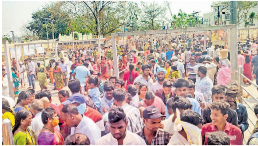
వినదేవితల సన్నిధిలో అమ్మవార్ల దర్శనానికి వస్తున్న భక్తులు

టీఆర్ఎస్ అధినేత కేసీఆర్ హాజరై ఆయా నియోజకవర్గాల నేతల నుంచి అభిప్రాయాలు సేకరించనున్నారు. ఇందుకోసం ఇప్పటికే కొందరు నాయకులు మహబూబాబాద్ చేరుకోగా, మరి కొంతమంది సోమవారం వెళ్తున్నారు. ఎమ్మెల్యేలు, ఎమ్మెల్యేలు, ఎంపీతోపాటు మాజీ ఎమ్మెల్యేలు, మాజీ ఎమ్మెల్యేలు, ఇతర ముఖ్య నాయకులు ఈ సమావేశంలో పాల్గొనున్నారు. ఈ సమావేశంలోనే టీఆర్ఎస్ పార్లమెంట్ అభ్యర్థి ఎవరనేది వెల్లడి కానుంది.