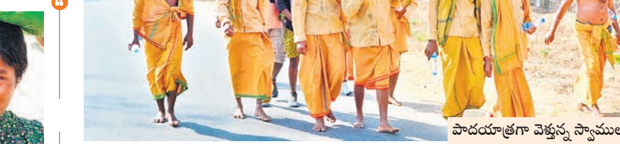
పాదయాత్రగా వెళ్తున్న స్వాములు

అభయారణ్యంలో సైతం.. శివస్వాముల పాదయాత్రా నల్లమల అడవి మీదుగా శ్రీశైలానికి చేరుకుంటున్నారు. అభయారణ్యం నైతం లెక్కచేయకుండా యాత్ర కొనసాగిస్తున్నారు. ఎత్తయిన కొండలను ఎక్కుతూ, దిగుతూ స్వామి సన్నిధికి చేరుకుంటున్నారు. ఓవైపు కాళ్ళు, శరీరం నొ పులు పెడుతున్నా, వాపులు, బొబ్బలు వచ్చినా.. అనారోగ్య సమస్యలు తలెత్తుకున్నా, చేతో కల్లను ఊతం చేసుకుంటూ దాదాపు 200 కిలోమీటర్ల దూరంలో ఉన్న మల్లన్నను దర్శించుకునేందుకు భక్తులు పయనిస్తున్నారు.