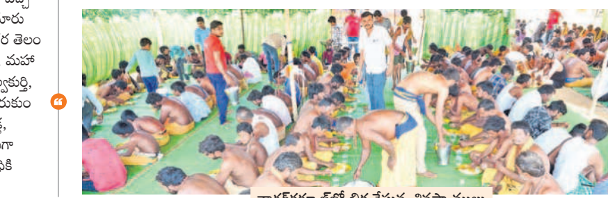
నాగర్ కర్నూల్ లో భిక్ష చేస్తున్న శివస్వాములు