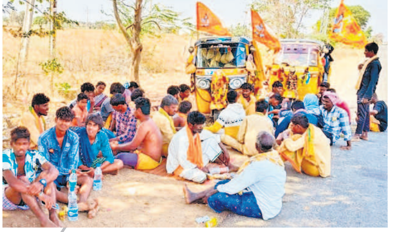
శ్రీశైలం వెళ్లే దారిలో విశ్రాంతి తీసుకుంటున్న స్వాములు

రహదారులపై శివభక్తులతో సందడిగా మారాయి. దాతలు ముందుకొచ్చి సేవాభావం చాటుతున్నారు. పట్టుకొని వారి ప్రాంతాల్లో విడిది చేస్తున్న శివస్వాములు, భక్తులతో వారం ముందే ఈ ప్రాంతాల్లో శివభక్తులు సంతరించుకున్నది. ఇక శివ స్వాముల కోసం కులు, మాలకతీతంగా ప్రజాసేవకు వచ్చిస్తున్నది. శ్రీశైలం రహదారి పాదయాత్ర అల్పాహారం, భోజనం, పండ్ల పంపిణీ చేస్తున్నారు. స్వచ్ఛంద సంస్థలు, శివారు ప్రాంతాల్లో బెంట్లు వేసి నీడ, నీళ్ళను అందిస్తున్నారు. విడిది కోసం బెంట్లను ఏర్పాటు చేశారు. అన్నదానాలు, ఫలహారాలు, నీటి పనపిణీతోపాటు రెస్ట్ తీసుకునేలా పనపలు కల్పించి వారి సేవలో తిరుగుతున్నారు. అనారోగ్య శివ గుర్రాల వారికి మందులు అందిస్తూ స్వాములపై ప్రేమను చాటుకొంటున్నారు. స్వాముల యాత్రలతో నల్లమలలో ఆధ్యాత్మిక శోభ నెలకొన్నది.